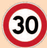
Panneau de type B14

Le panneau de limitation de vitesse de type B14 ne s'applique que sur l'axe sur lequel il est implanté jusqu'à un panneau modifiant cette prescription.