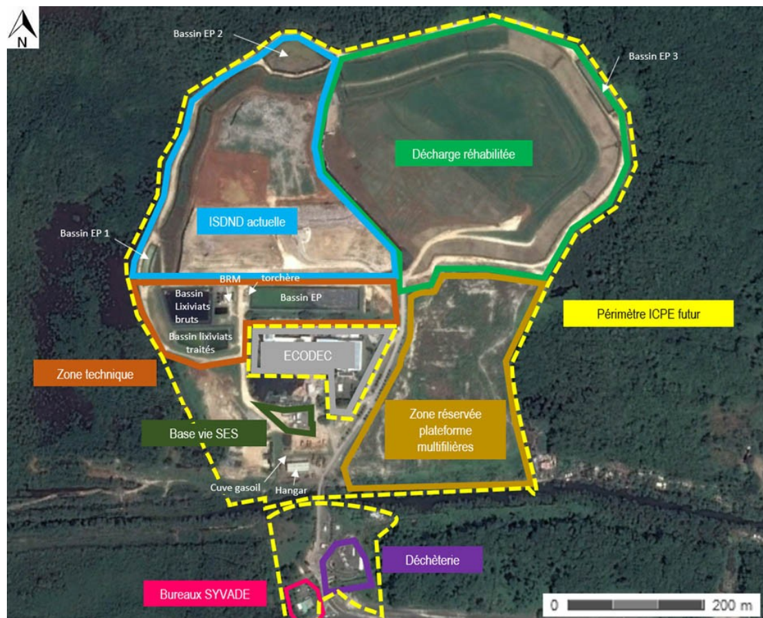
Figure 2 : Installations présentes au sein du site de la Gabarre selon le nouveau périmètre ICPE proposé