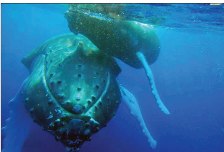
Légende : baleine à bosse ( Megaptera novaeangliae ) et son jeune dans les eaux Guadeloupéennes.

Depuis 2010, l'Agence des aires marines protégées finance le fonctionnement et la mise en place du sanctuaire. Au-delà de ces moyens matériels, le partenariat est le levier moteur d'Agoa. Le sanctuaire ambitionne de fédérer les élus et tous les acteurs, qu'ils soient associatifs, socio-économiques ou scientifiques, avec l'appui de l'État, autour de ses objectifs [de gestion, de sensibilisation, de protection et de connaissance].