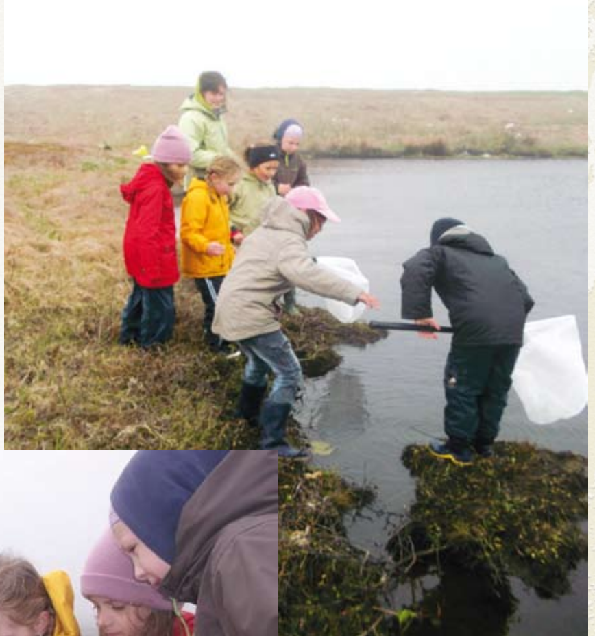
Les enfants à la pêche aux insectes

Les petites bêtes de la mare n'ont plus de secrets pour les participants à la Fête de la Nature, placée sous le thème national des «petites bêtes». Le 25 mai 2013, huit enfants âgés de 8 à 12 ans ont découvert des coléoptères aquatiques, la sangsue, des larves de tricoptères... Ils ont pêché des insectes avant de les observer à la loupe et ont fait de leur mieux pour les reconnaître, grâce à des clés d'identification. L'événement, organisé par la Maison de la nature et de l'environnement, en partenariat avec l'antenne du Conservatoire du littoral et une amie de la nature bénévole pour Miquelon, s'est terminé dans la joie, avec des jeux pédagogiques.