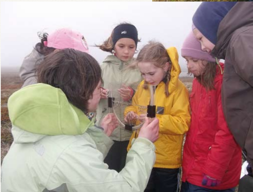
Observation d'une larve de tricoptère