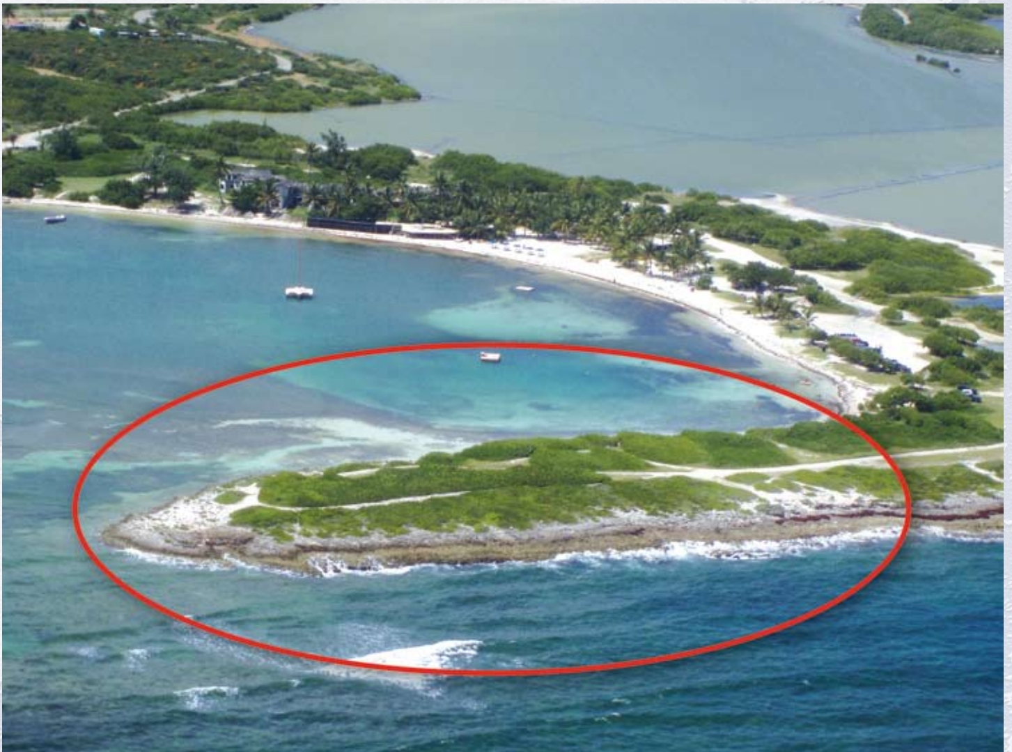
Cette presqu'île a été acquise en 2012 par le Conservatoire du littoral sur la Baie de l'Embouchure, à Saint-Martin

écologique, paysager et culturel des zones envisagées, et par rapport aux menaces détectées (urbanisation, agriculture intensive, érosion...). Le travail va consister également à mieux identifier les démarches des autres acteurs de la protection du littoral (collectivités, établissements publics, réserves naturelles, parcs...). La révision de la stratégie devra être prête en 2014 et des stagiaires sont déjà à l'œuvre pour chacun des conseils de rivages.