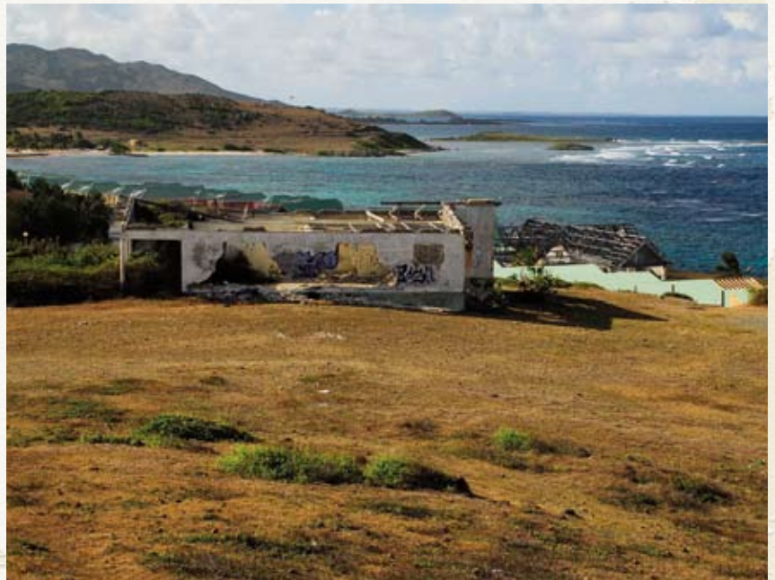
Babit Point: cette ruine sera prochainement détruite

Le site de Babit Point et sa richesse écologique exceptionnelle seront très prochainement placés sous la protection intégrale du Conservatoire du littoral. En surplomb de la baie d'Oyster Pond, le site est remarquable pour son intérêt paysager, ouvert sur l'océan et Saint-Barthélemy, mais surtout pour sa rareté botanique, puisqu'il est l'une des deux seules stations de l'île où abonde le Melocactus intortus , le fameux «tête-à-l'anglais», cactus protégé endémique des Petites Antilles. Trois parcelles, pour une superficie totale de 1.8 hectares, ont été acquises par le Conservatoire en avril dernier auprès des propriétaires vendeurs, ce qui représente la première acquisition amiable du Conservatoire à Saint-Martin.