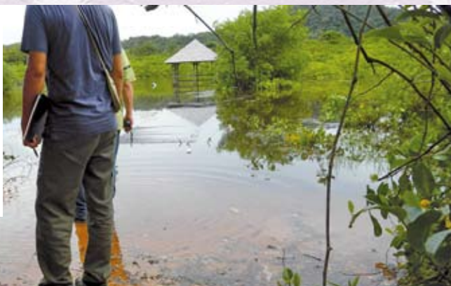
Les pieds dans l'eau sur le sentier littoral

Le littoral est fragile et sans cesse à la merci des humeurs de la mer. À Cayenne, après deux forts épisodes de houle couplés à de grandes marées, le phénomène d'érosion de la mangrove et des plages de sable s'est accéléré. Sur le site des Salines, le sentier originellement situé en arrière-plage a maintenant les pieds dans l'eau et il faut deviner son ancien tracé. L'observatoire est toujours accessible, mais l'accès à la passerelle est fermé en raison des dégâts.