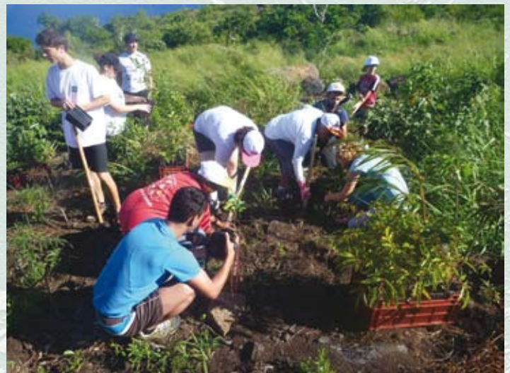
Un chantier bénévole