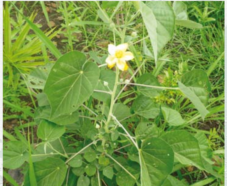
Une mauve en fleur

Simultanément, les actions de sensibilisation auprès de la société civile se sont poursuivies et une dizaine de chantiers bénévoles se sont tenus au plus fort de l'été austral afin de planter. Plusieurs comités d'entreprise ont renouvelé leur investissement dans le projet et le lycée agricole de Saint-Paul y a consacré un de ses chantiers pédagogiques. De son côté, le GCEIP (Groupe pour la conservation de l'environnement et de l'insertion professionnelle), gestionnaire du site de la Grande Chaloupe, a entrepris une première campagne d'entretien des plantations réalisées l'an passé.