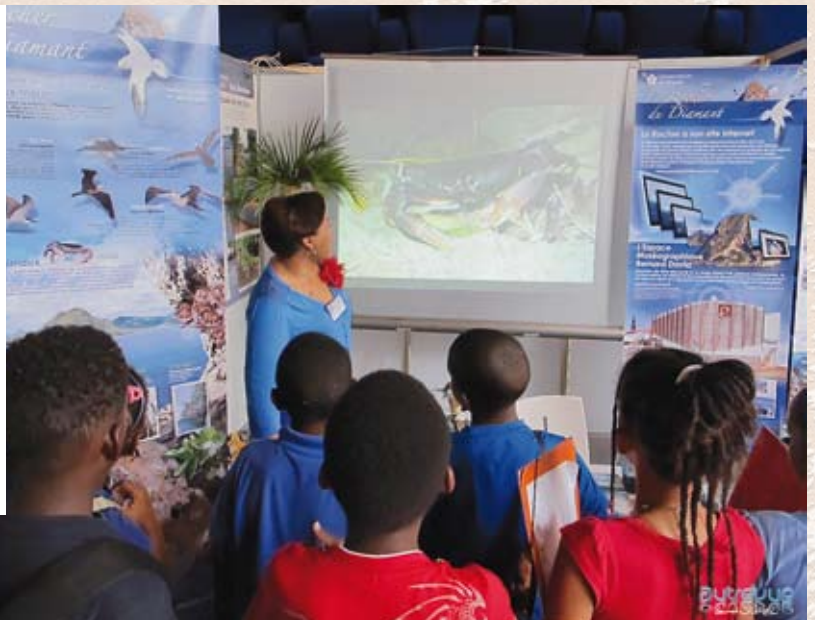
▲ Un beau crabe, en direct du Rocher du Diamant pour ce groupe d'écoliers

La visite virtuelle du Rocher du Diamant a permis à quelque cent participants du forum Bod Lan Mé, de découvrir ce site à partir des 4 caméras disposées sur le Rocher et d'une caméra sous-marine. Ainsi, de nombreux scolaires ont bénéficié en avant-première d'une projection en direct de ces images de très bonne qualité, au stand tenu conjointement par la commune du Diamant et le Conservatoire du littoral durant le forum. Cette réussite incite le Conservatoire à poursuivre son projet de transmettre les vidéos du Rocher du Diamant à l'aéroport du Lamentin, mais aussi dans certains hôtels.