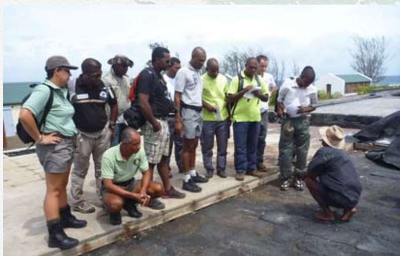
Les gardes réunionnais et mahorais à la Pointe au Sel.