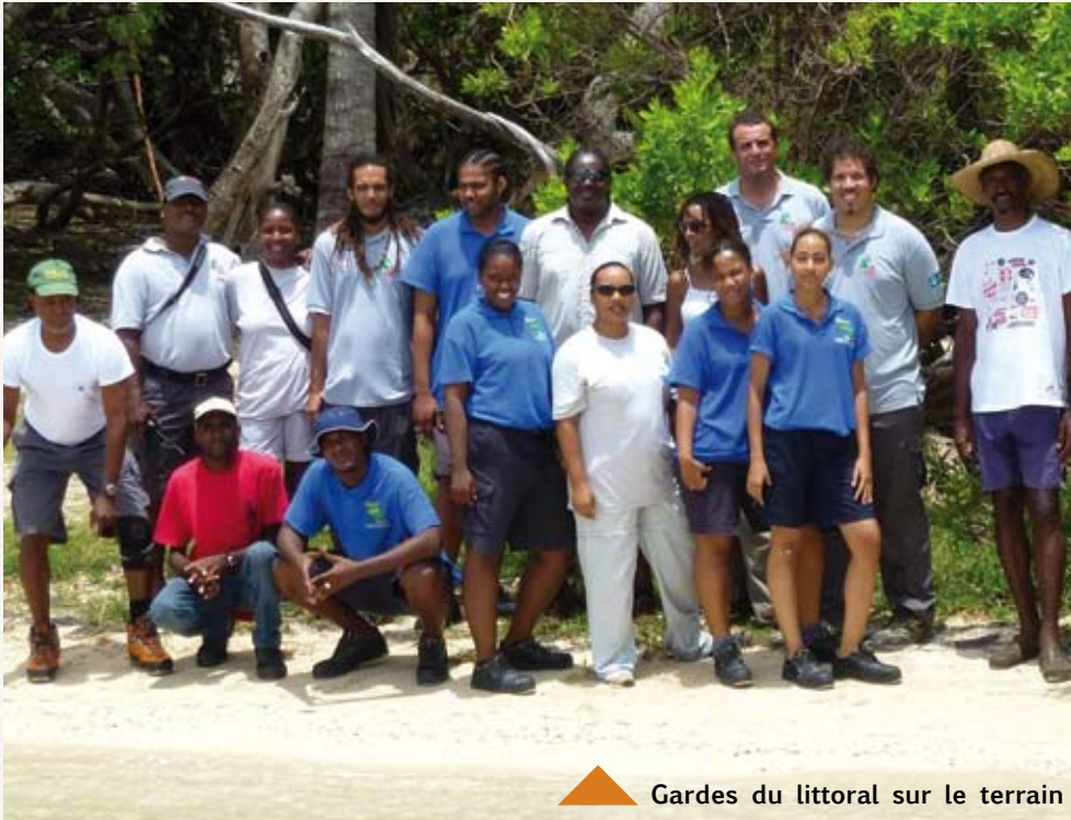
▲ Gardes du littoral sur le terrain

Dix nouveaux gardes du littoral ont reçu en avril 2013 l'arrêté préfectoral de commissionnement, précieux sésame qui officialise leur statut. Ils vont prochainement prêter serment devant le tribunal d'instance de Martinique. Sélectionnés en 2011 à l'issue d'une session d'information sur le métier de garde organisée par l'ATEN, ils ont depuis bénéficié de plusieurs formations – grâce au CNFPT et à l'ATEN – et ont pris pleinement conscience de leurs missions grâce à l'amélioration de leurs connaissances. Sept de ces gardes sont salariés de la Communauté d'agglomération de l'espace Sud, un de la commune du Robert, un autre de la commune du Marin et un dernier du Comité de randonnée pédestre.