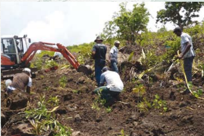
Reprise des plantations, mais en bande de taille et d'espacement variable