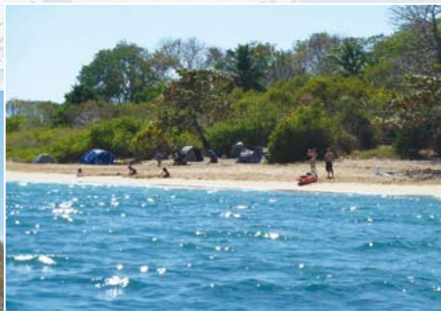
Campement de touristes sur une plage de Bandré

Afin de limiter les populations de rongeurs et protéger ainsi les couvées des oiseaux marins, une nouvelle campagne de dératisation vient d'être menée sur les îlots d'Hajangoua, où le potentiel en matière de nichage du Phaéton est reconnu. Cette campagne a consisté à la fois à poser des pièges non vulnérants et à disposer des stations d'appât dans des lieux judicieusement choisis, pour ne pas nuire aux autres espèces.