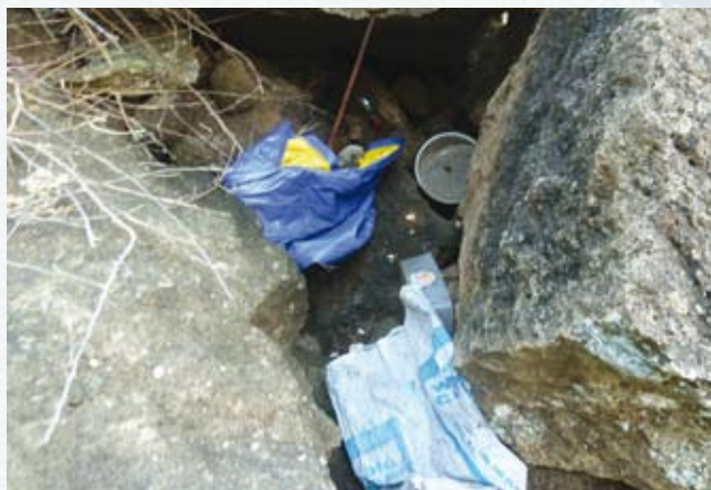
Les anfractuosités de rochers ne sont pas des poubelles...

Plages isolées de sable blanc, eaux turquoise, failles sous-marines, peuplements de coraux... Les 36 îlots du lagon de Mayotte sont autant de joyaux naturels, que le Conservatoire du littoral et le Conseil général s'attachent à protéger de leur mieux. Début 2013, avec l'appui de l'association des Naturalistes de Mayotte, la première étape a été de rencontrer les usagers – pêcheurs, touristes, campeurs, plongeurs, kayakistes, kite surfeurs... – afin d'élaborer avec eux un plan de gestion ainsi qu'un projet de charte de bonne conduite environnementale pour les quatorze îlots situés à l'Est du lagon. L'objectif est de limiter l'impact des activités humaines sur l'environnement, en commençant par exemple à ne laisser aucun déchet sur les îlots, ne pas amener son chien, ne pas toucher les animaux sauvages, utiliser les bouées d'amarrage ou ancrer dans le sable, ou limiter sa pêche à sa consommation personnelle.