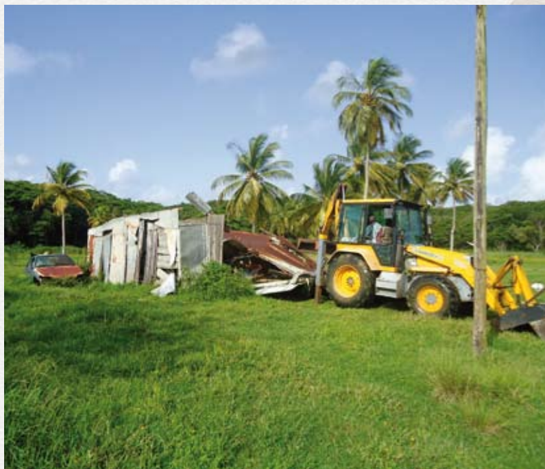
Grand nettoyage à Golconde

Deux jours durant, les 14 et 15 juin, les sites de Golconde et de Belle-Plaine, aux Abymes, ont fait l'objet d'une grande opération de nettoyage. Initié en partenariat avec le Conservatoire du littoral, la commune des Abymes et le Parc national de Guadeloupe, qui avaient mis à disposition des camions bennes et des pelles mécaniques, ce coup de propre a mobilisé les associations de riverains, encadrés par les trois gardes du littoral de la commune des Abymes. Cette action accompagne Taonaba, Maison de la mangrove et projet écotouristique de la ville des Abymes, qui a pour but d'aménager et de valoriser le canal de Belle-Plaine et les zones humides qui lui sont associées. Cette action a été l'occasion d'agir et de communiquer sur le respect des zones naturelles, souvent transformées en dépotoirs sous la végétation cache-misère, mais également de poursuivre l'encadrement des occupations agricoles. La démarche de régularisation de l'activité agricole est en cours, en association avec les gardes du littoral, et va permettre la mise en place de conventions et de cahiers des charges agricoles pour une meilleure gestion du site.