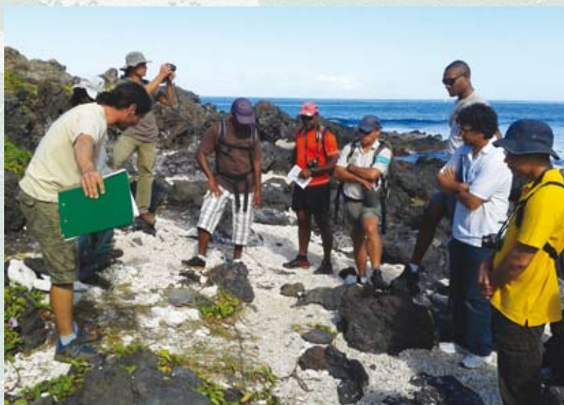
Les gardes du littoral sur le site de la pointe de Trois Bassins

Les gardes du littoral exercent un beau métier et méritent que leurs compétences soient valorisées. Ainsi, les 16 et 17 mai 2013, Rivages de France et le Conservatoire du littoral ont organisé deux journées de sensibilisation au métier de gardes du littoral, à l'attention des nouveaux gardes réunionnais, mais aussi de leurs collègues plus anciens, pour une compréhension accrue de leurs missions. La première journée, en salle, a été axée sur une présentation globale des espaces naturels, de leur rôle, des enjeux et des menaces dont ils font l'objet, des outils de leur protection et de leur bonne gestion. La seconde journée, consacrée aux modes de gestion sur le terrain, a permis aux participants de découvrir d'un oeil neuf le site du cap la Housaye et celui de la pointe de Trois-Bassins.