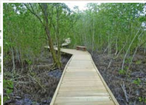
Le chemin serpente dans la mangrove

les voitures et les autobus a été créée, et une autre plus petite, mais plus proche de la plage, en pensant aux personnes âgées ou handicapées. L'ancienne route, qui conduisait au rivage, a été transformée en allée piétonne, et devient même sentier de découverte lors de son passage sur caillebotis dans la mangrove. Des assises en rondins de bois attendent les amateurs de bains de boue. Reste à installer quelques points feu. 45 plantations confiées aux gardes du littoral viendront prochainement compléter cet environnement dédié à la détente. La commune de Morne-à-l'Eau a d'ailleurs recruté trois gardes. La seconde étape consistera en la création d'un sentier de randonnée.