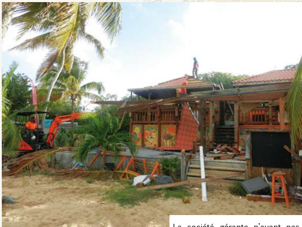
Le bâtiment au démarrage du chantier de démolition

Le restaurant de plage The Key, sur l'îlet Pinel, vient d'être détruit. Cette démolition très attendue est l'aboutissement de plusieurs années de contentieux. Pour rappel, ce restaurant déjà illégal s'était agrandi en 2008 et avait ajouté un étage sur le domaine maritime, sans autorisation. L'établissement avait refusé de se mettre en conformité, contrairement à ses voisins, et ignoré les prescriptions environnementales ainsi que le versement à la Réserve naturelle d'une redevance destinée à la gestion des sites. Après plusieurs tentatives de recherche d'une solution amiable, une contravention de grande voirie à l'encontre de la société gérante a été engagée par le Conservatoire en juillet 2010, pour occupation illégale du domaine public. Suite à cette procédure, le tribunal administratif de Saint-Martin avait condamné le 22 mars 2012 la société gérante à démolir le bâtiment. Cette condamnation avait été confirmée en appel le 29 novembre 2012.