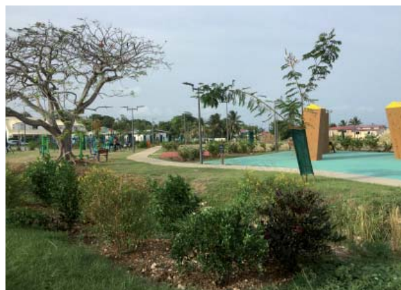
parc Saint-Jean (Petit-Bourg)