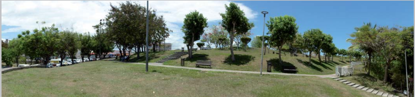
parc paysager du Calvaire à Gosier