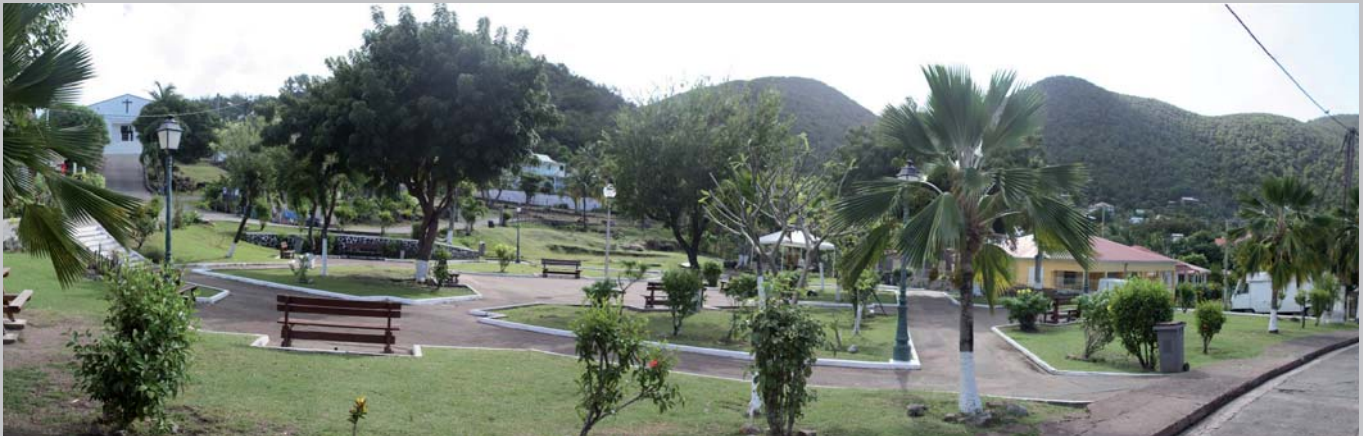
square de Grande Anse de Terre-de-Bas

quelques exemples de parcs et squares urbains en Guadeloupe