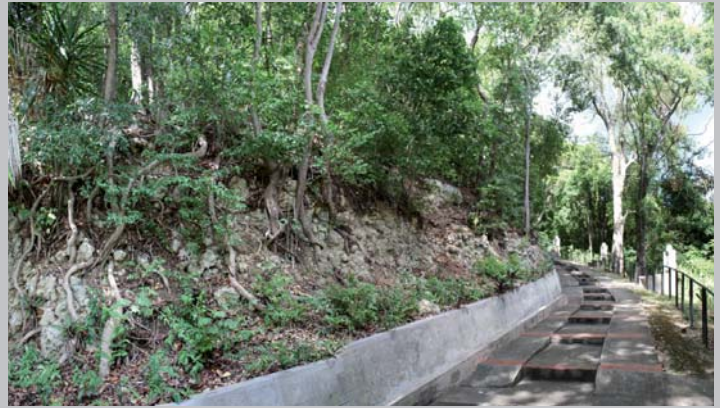
Morne Calvaire aux Abymes