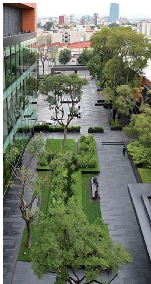
Coyoacán Corporate Campus (Mexico)

La végétation ne doit pas présenter de danger pour le public, notamment pour les enfants, souvent nombreux dans un square ou un parc urbain. Il faut donc éviter les végétaux porteurs d'épines ou de fruits lourds (Cocotier, Abricotier pays, etc.) et sélectionner des espèces sans toxicité avérée (v. fiche 1.4). Les espèces fruitières sont également à proscrire au-dessus des bancs et à proximité immédiate des aires de jeux d'enfants pour ne pas détériorer les mobiliers (souvent coûteux) ou salir les revêtements de sol.