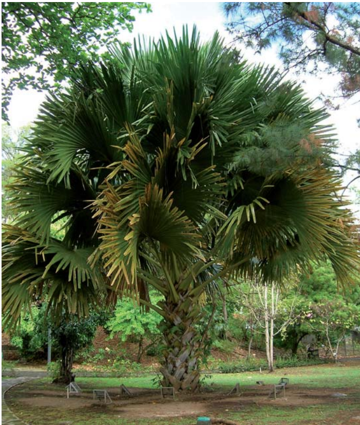
Jardin Botanique de Basse-Terre

À l'inverse des places urbaines, les surfaces minérales sont secondaires dans un square ou un parc urbain où l'essentiel de l'espace est occupé par des pelouses et des surfaces plantées au milieu desquelles circulent des allées. Les arbres y ont un rôle essentiel. Ils définissent l'identité du lieu.