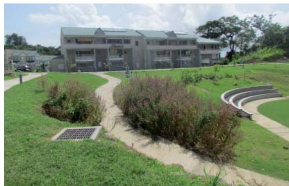
parc Bellemont (résidence Alloua Touna, Trois-Rivières)