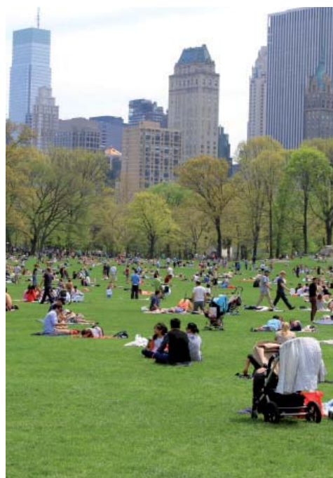
Central Park, poumon vert de New York

quelques arbres et palmiers adaptés aux parcs et squares urbains :