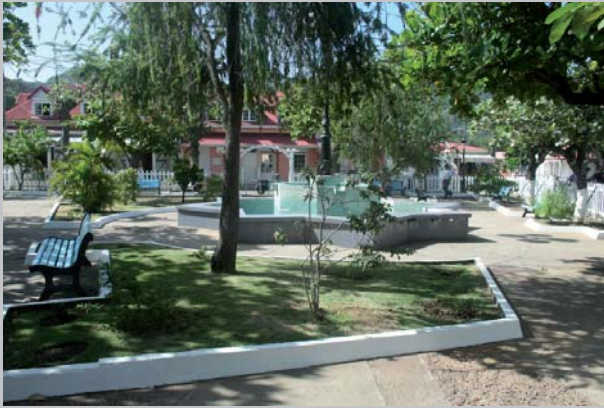
square Hazier Dubuisson à Terre-de-Haut