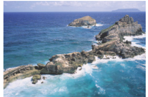
Pointe des Colibris, au fond la Désirade

Superficie : 733 ha, dont 175 pour la partie terrestre