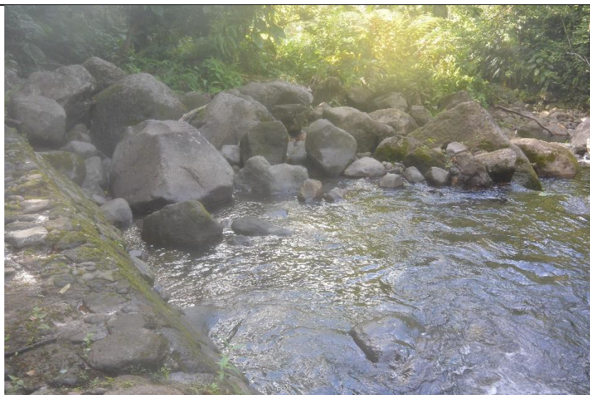
Photo 1 Site pour la prise d'eau (amont du seuil existant sur le Galion)