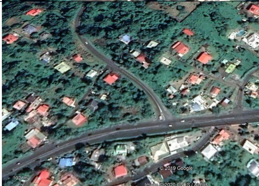
Photo 5 Tracé de la conduite forcée : arrivée de la RD9 sur la RN1