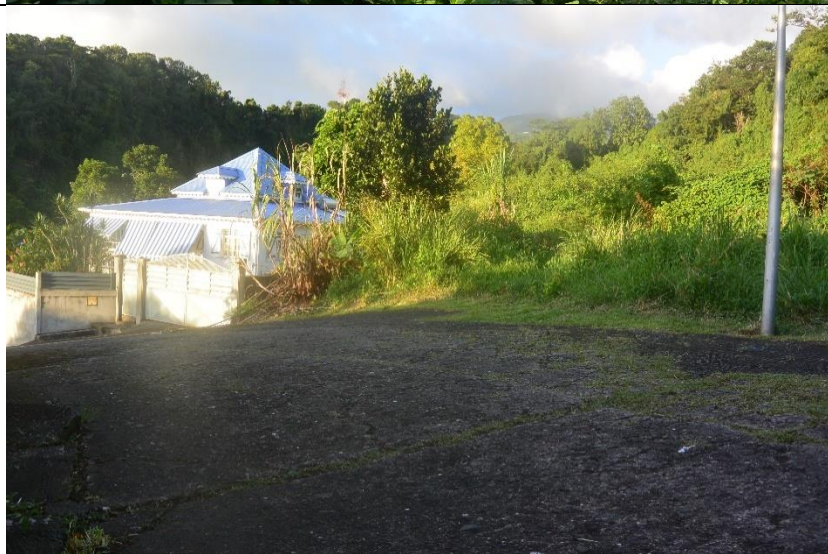
Photo 3 Tracé de la conduite forcée sur voirie communale (avant arrivée sur la D9)