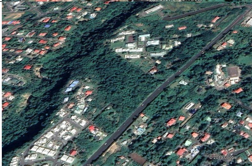
Photo 6 Site pour le bâtiment de turbinage : aval des bâtiments du centre Médico Pédagogique