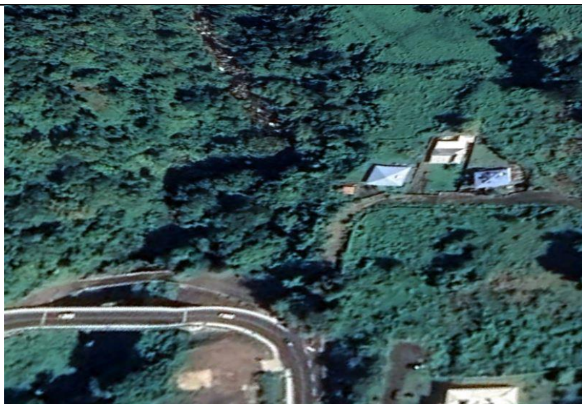
Photo 4 Tracé de la conduit forcée : arrivée de voie communale sur la RD9 en aval du pont des Marsouins