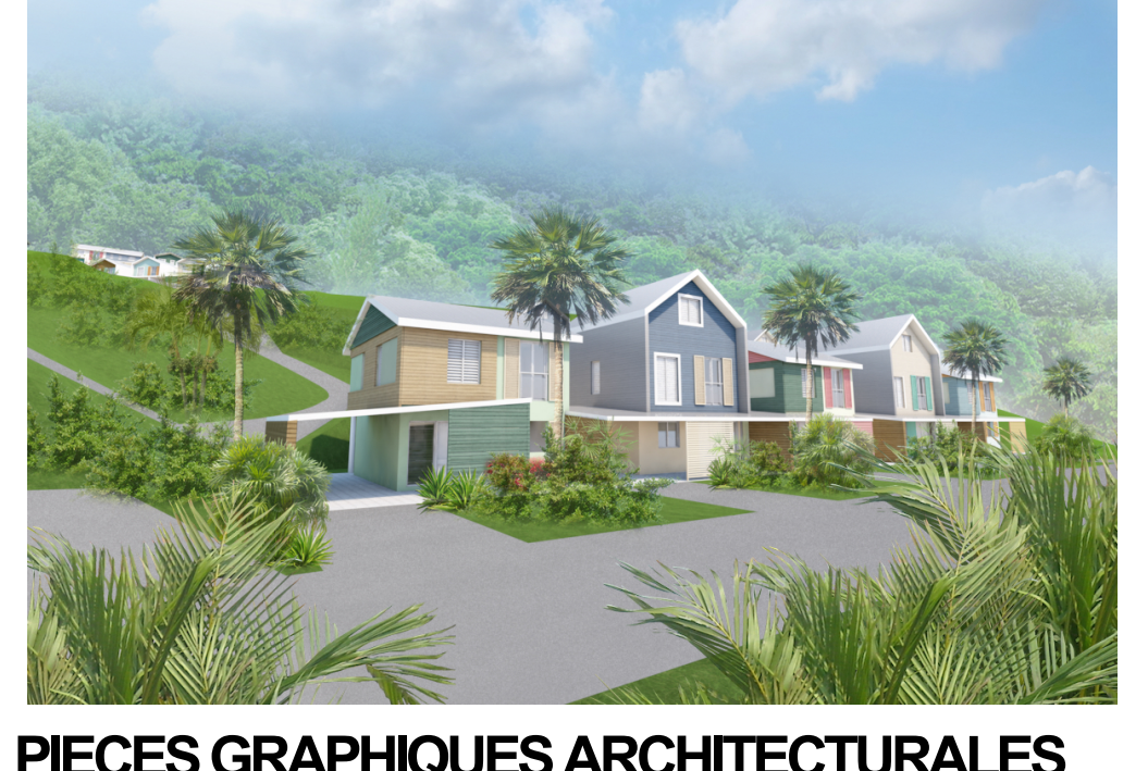
PIECES GRAPHIQUES ARCHITECTURALES