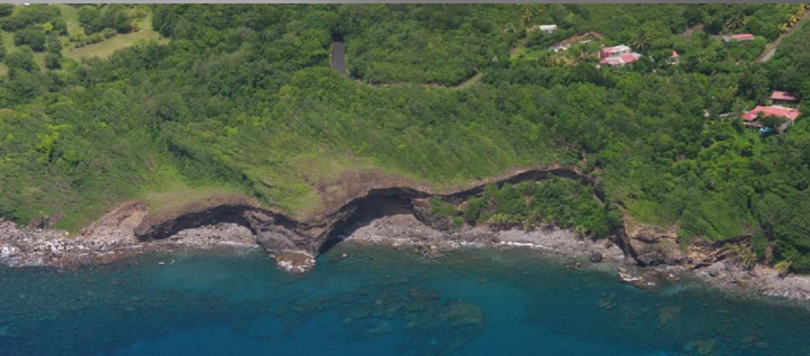
Mes falaises-racines des Monts Caraïbes

Les curiosités paysagères ... les amers de racines et de roches