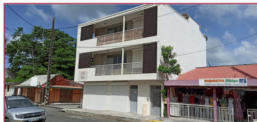
Morne-à-l'Eau après travaux

Soliha AIS Guadeloupe Tél : 05 90 91 43 38