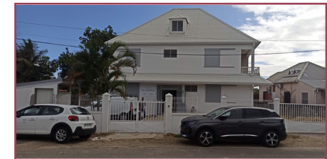
Abymes (Dothémare) après travaux