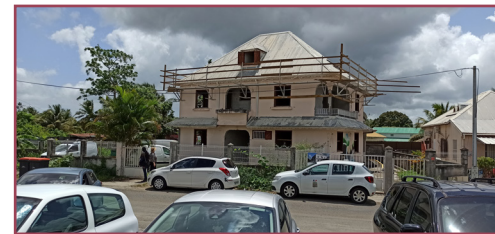
Abymes (Dothémare) avant travaux