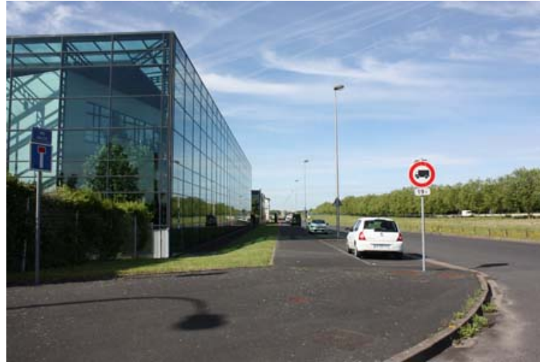
Îlot3 : voie interdite aux poids lourds