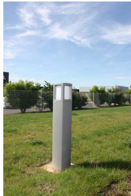
Cheminements piétons et Stationnements : hauteur maximale 1m