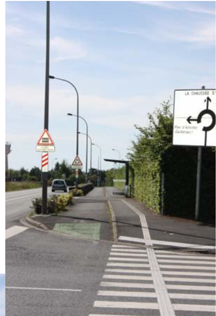
Pistes cyclables, cheminements doux et dessertes TC