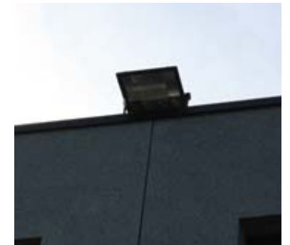
Eclairage des façades autorisé sur l'îlot 3 uniquement