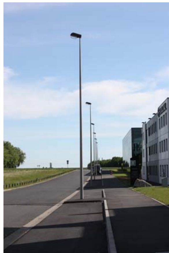
Mâts autorisés uniquement sur la voie publique