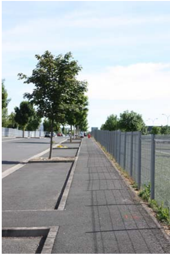
Des trottoirs sur toutes les rues