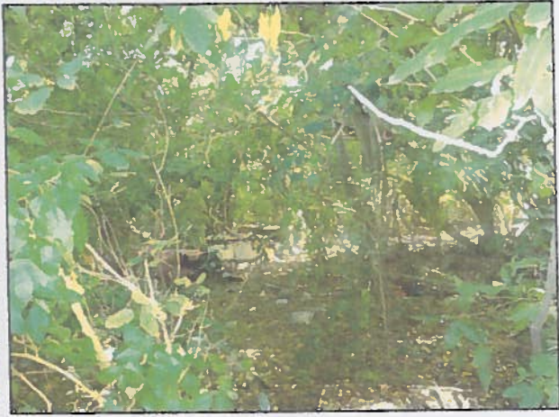
Aspect intérieur du boisement avec déchets ménagers