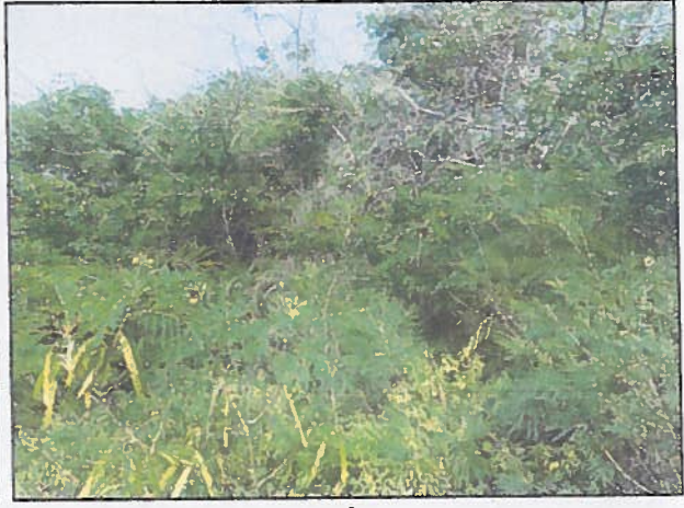
Aspect extérieur du boisement partie centrale