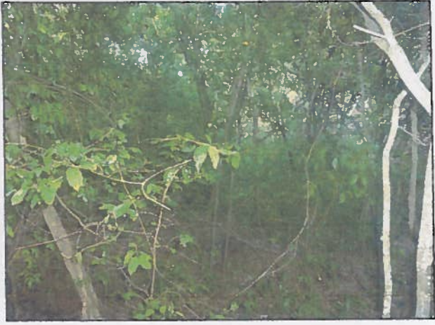
Aspect intérieur du boisement partie centrale