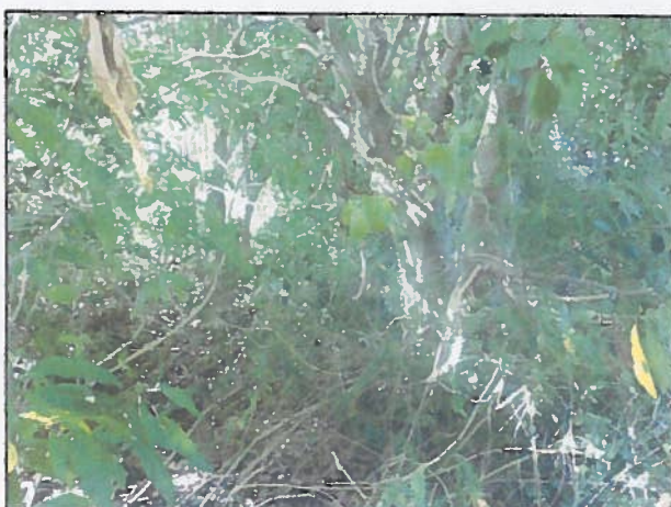
Aspect intérieur du boisement