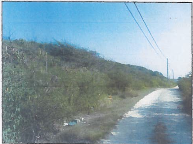
Le site sur la gauche du chemin