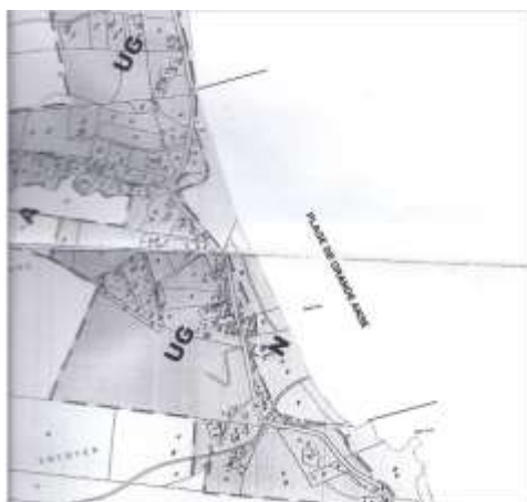
Extrait du document d'urbanisme en vigueur