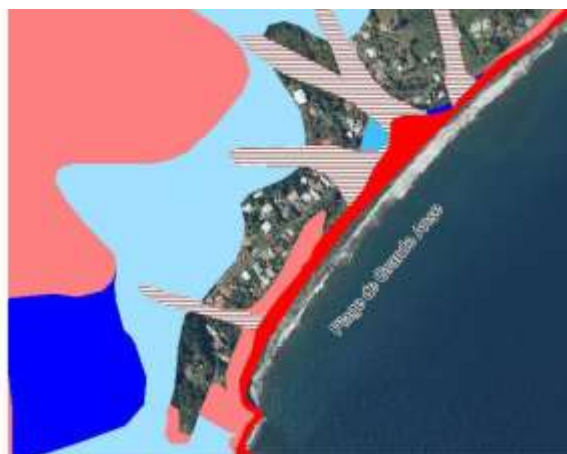
Extrait du PPRn en vigueur