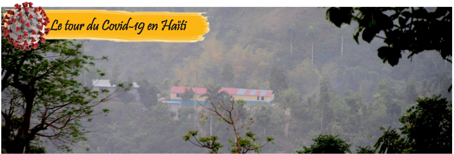
L'école nationale de Castache dans la Grand'Anse, réhabilitée par Solidarité Laïque, située à des kilomètres de toute habitation.