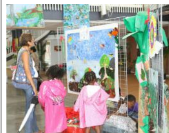
Projet d'éducation à l'environnement dans les écoles du Lamentin