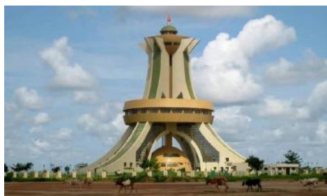
Ouaga 2000