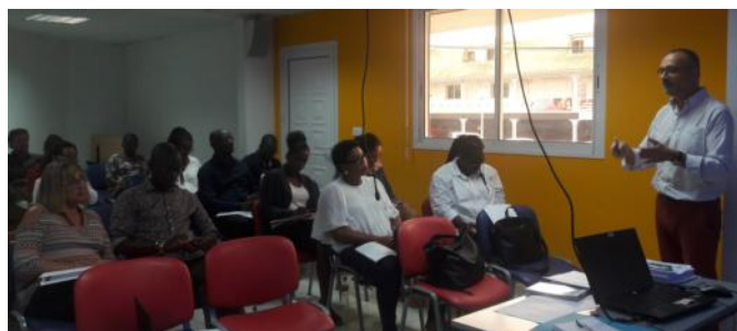
Formation sur les financements européens pour l'action extérieure au CNFPT de Guadeloupe