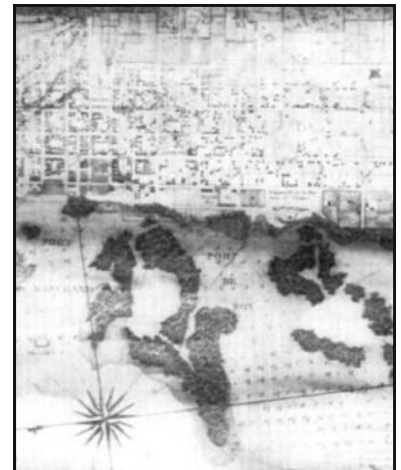
Port-au-Prince en 1785

C'est par une ordonnance signée au Petit-Goâve, de Messieurs de Conflans et Maillard que fut fondée officiellement, le 13 juin 1749, la paroisse de Port-au-Prince, après fusion des paroisses du Cul-de-Sac et du Trou Bordet dont les habitants ont été invités à se déplacer vers le nouveau site. Auparavant le site avait été choisi par les Espagnols qui y fondèrent Santa Maria del Puerto. Il fut abandonné en 1605 au moment des terribles dévastations d'Osorio qui vidèrent la partie occidentale de l'île de sa population espagnole rapatriée de force vers l'Est. Il devint le Port l'Hôpital, utilisé par les flibustiers. Choisi pour la qualité de son mouillage et sa situation centrale par rapport au reste de la colonie, le site fut de nouveau rebaptisé et devint le Port-au-Prince en 1749. Il doit son nom au navire éponyme, le Prince, monté par M. de Saint André, qui y trouva refuge en 1706, menacé par une escadre anglaise qui rôdait dans la baie du Cul de Sac. Lire la suite