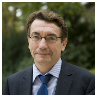
Jean-Paul ALBERTINI Délégué interministériel et Commissaire général au développement durable

Ce deuxième plan national d'action pour les achats publics durables, qui s'étendra sur la période 2014 – 2020, s'inscrit dans une politique communautaire visant à orienter la production et la consommation des biens et services vers le développement durable.