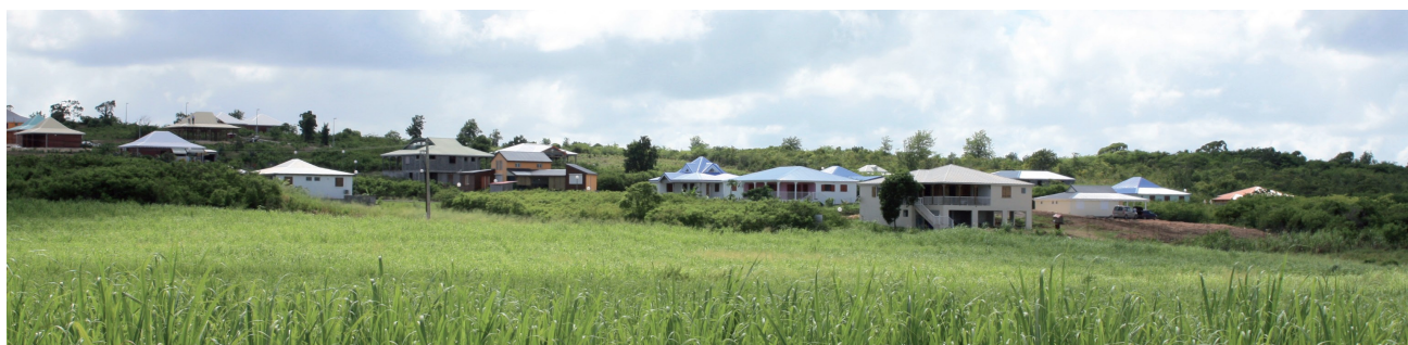
Atlas des paysages de l'archipel Guadeloupe – nouveau lotissement en limite des vallons de Guéry

Une tendance récente voit cependant le développement d'une poche urbaine dans les vallons de Guéry, dont l'organisation repose sur la forme de lotissement. L'aboutissement de cette opération et sa multiplication prévisible sur d'autres sites pèseront sur la structure paysagère concernée, appuyant les enjeux de mitage et d'intégration paysagère délicate de ce nouvel habitat pavillonnaire.