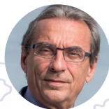
Roland Ries, Président de Cités Unies France

Depuis 2010, Cités Unies France propose un évènement annuel aussi fédérateur qu'incontournable dans le monde de la coopération décentralisée, décrit comme « le Davos de l'action internationale des collectivités territoriales » par la Présidence de la République lors de la venue du Président François Hollande en 2015.