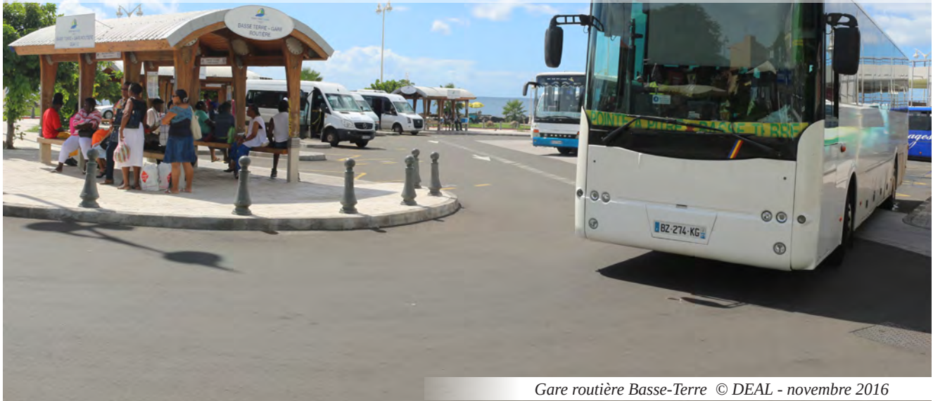
Gare routière Basse-Terre © DEAL - novembre 2016

Le service FTES est chargé de contribuer à la politique locale de transport, de mettre en œuvre les politiques d'éducation et de sécurité routières, et d'assurer le contrôle des transports terrestres et la tenue des registres de transporteurs. De plus, il coordonne la mise en œuvre au sein de la DEAL des financements européens et nationaux.