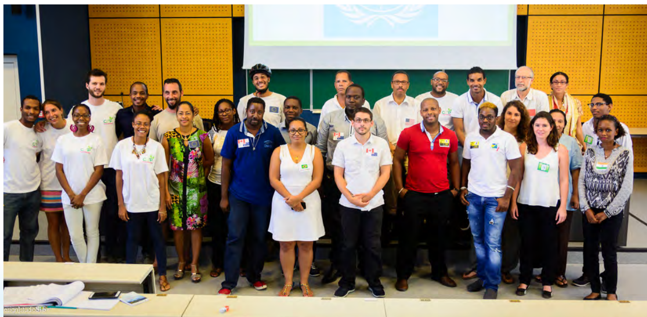
COP Guadeloupe - université des Antilles restitution - janvier 2016

MDDEE a été lauréate AAP du CGDD pour la proposition de création d'un Comité Régional de Transition Ecologique (CRTE).