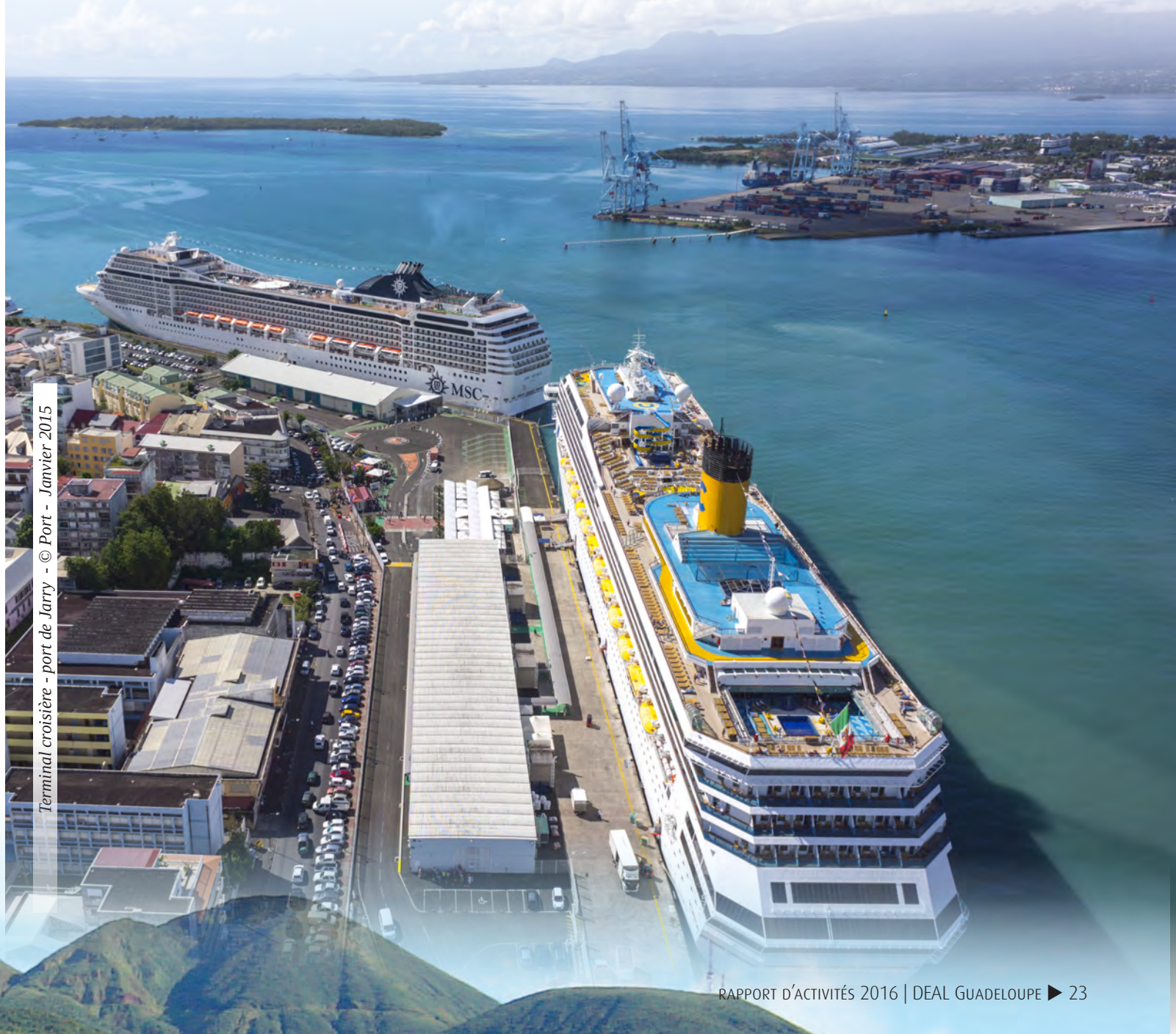
Terminal croisière - port de Jarry - Janvier 2015

Par ailleurs, le pôle a piloté la mise en œuvre opérationnelle du CPER 2015-2020 qui a été signé le 8 août 2015 : programmation, suivi et bilan d'exécution 2015, prévisions de consommation de crédits des autres unités