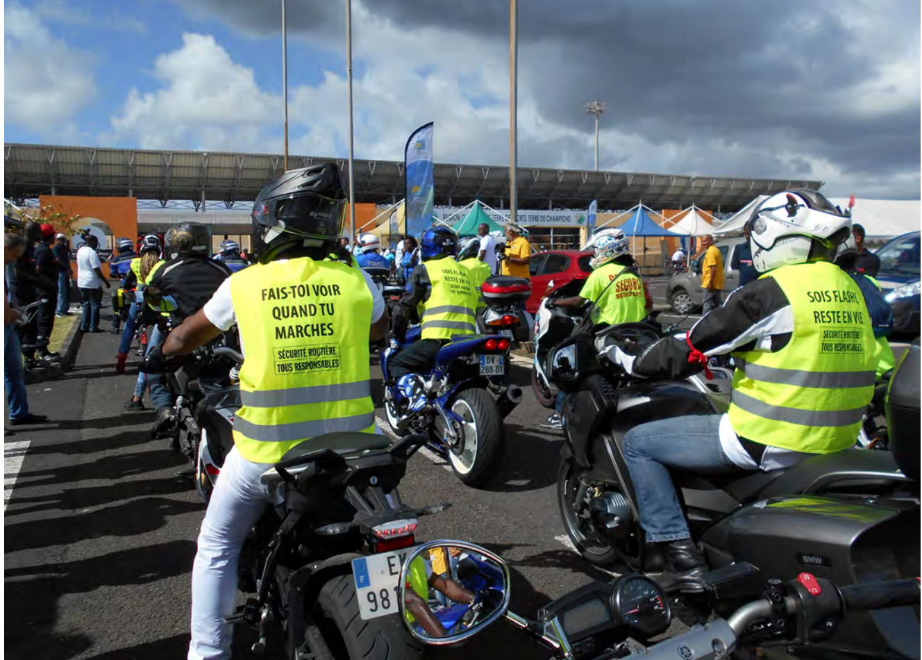
Journée régionale de la Sécurité Routière

2017 au moins 3 cas d'accidents graves ou mortels dont les circonstances sont imprécises.