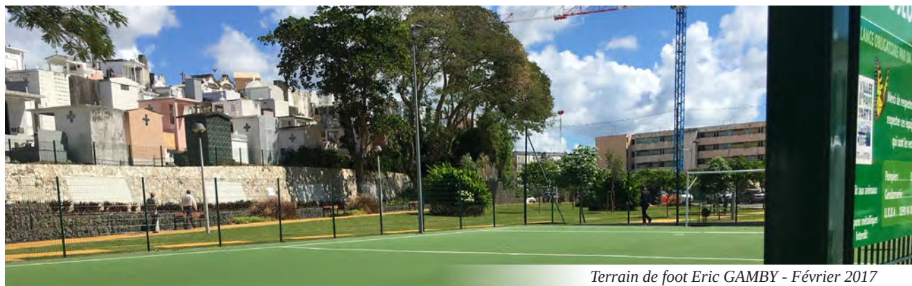
Terrain de foot Eric GAMBY - Février 2017

En tant que délégation territoriale de l'agence nationale pour la rénovation urbaine (ANRU), la mission Rénovation Urbaine de la DEAL est chargée du pilotage, de la supervision et de l'administration locale des projets de rénovation urbaine conventionnés avec l'ANRU.