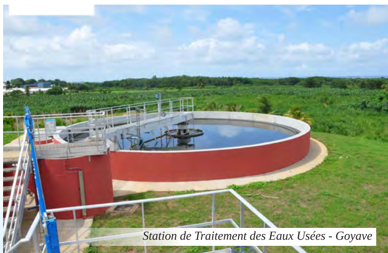
Station de Traitement des Eaux Usées - Goyave

DEAL sur le respect des préconisations pour le ramassage et le stockage des algues, ont été déployées dans toutes les intercommunalités. Les lauréats de l'appel à manifestation d'intérêt de l'ADEME ont commencé à mettre en œuvre leurs projets.