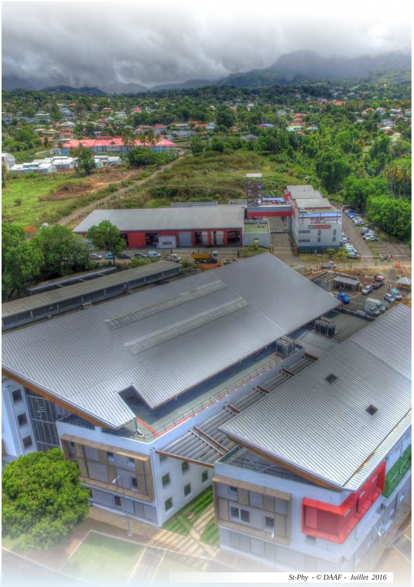
St-Phy - Juillet 2016