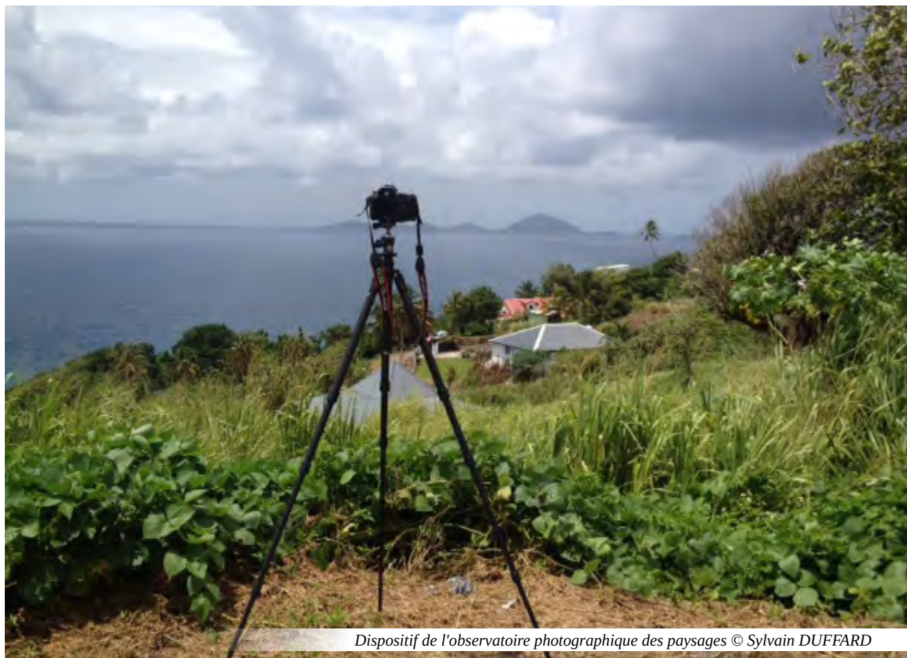
Dispositif de l'observatoire photographique des paysages

Le service prospective, aménagement et connaissance du territoire a été créé à l'occasion de la réorganisation de la DEAL en 2016 à partir de la fusion du service aménagement du territoire et organisation du littoral (ATOL) et du service opérationnel de conseil et d'appui (SOCA) auxquels a été intégrée l'unité statistiques précédemment rattachée à la mission développement durable et évaluation environnementale. Par contre, l'unité en charge de l'accessibilité a été quant à elle rattachée au service habitat et bâtiment durables.