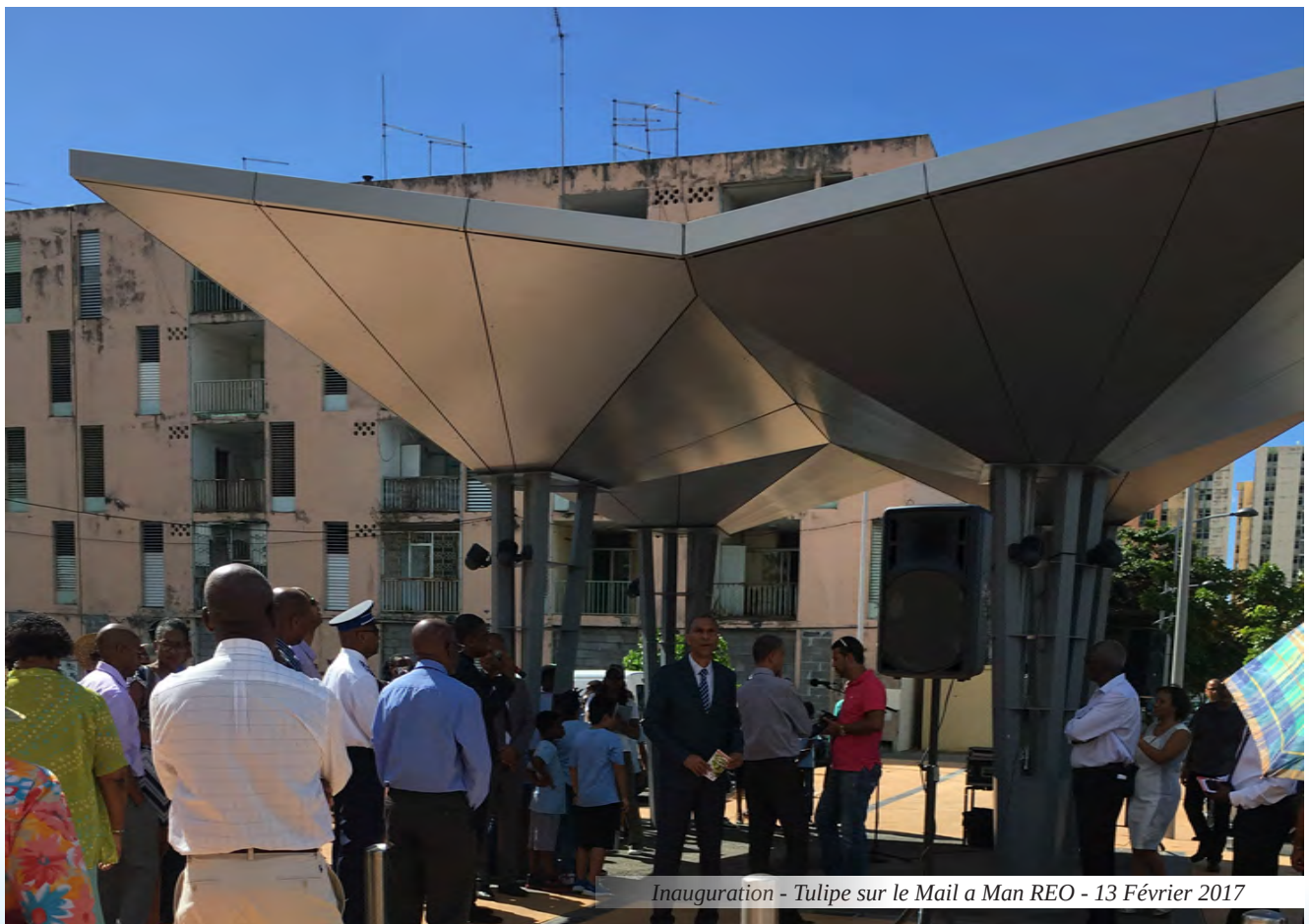
Inauguration - Tulipe sur le Mail a Man REO - 13 Février 2017

La DEAL accompagne Cap Excellence dans la construction de son nouveau programme de renouvellement urbain, dont la première étape se traduira par la signature d'un protocole de préfiguration, dans le courant de l'année 2017.