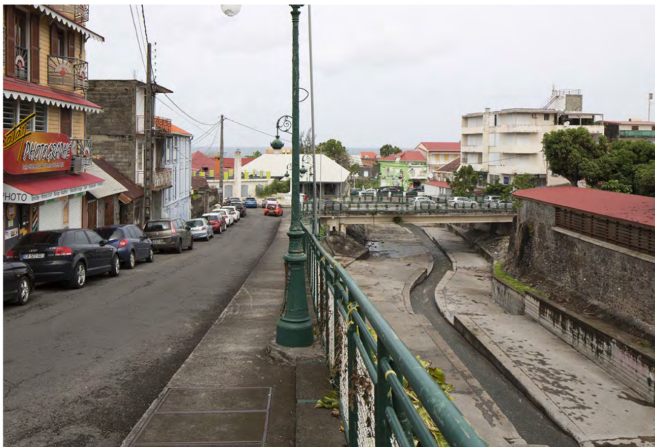
DE NOS JOURS - Montée du «Galibé» - vue du Pont Bernus