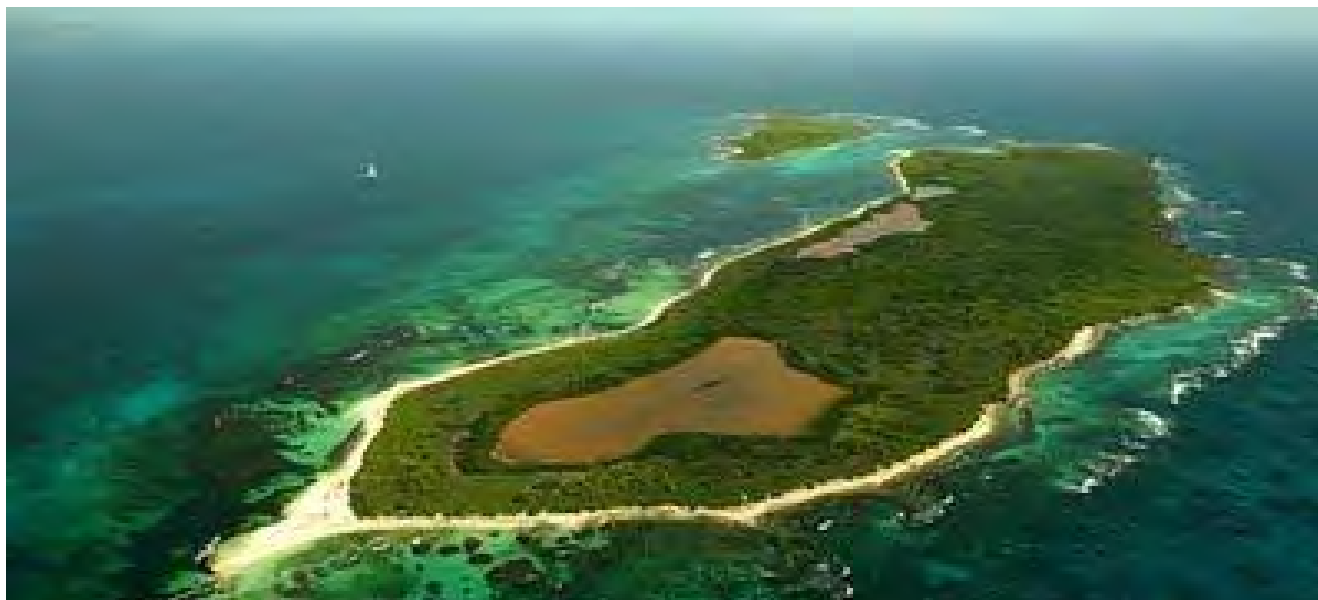
Petite Terre Désirade vue aérienne