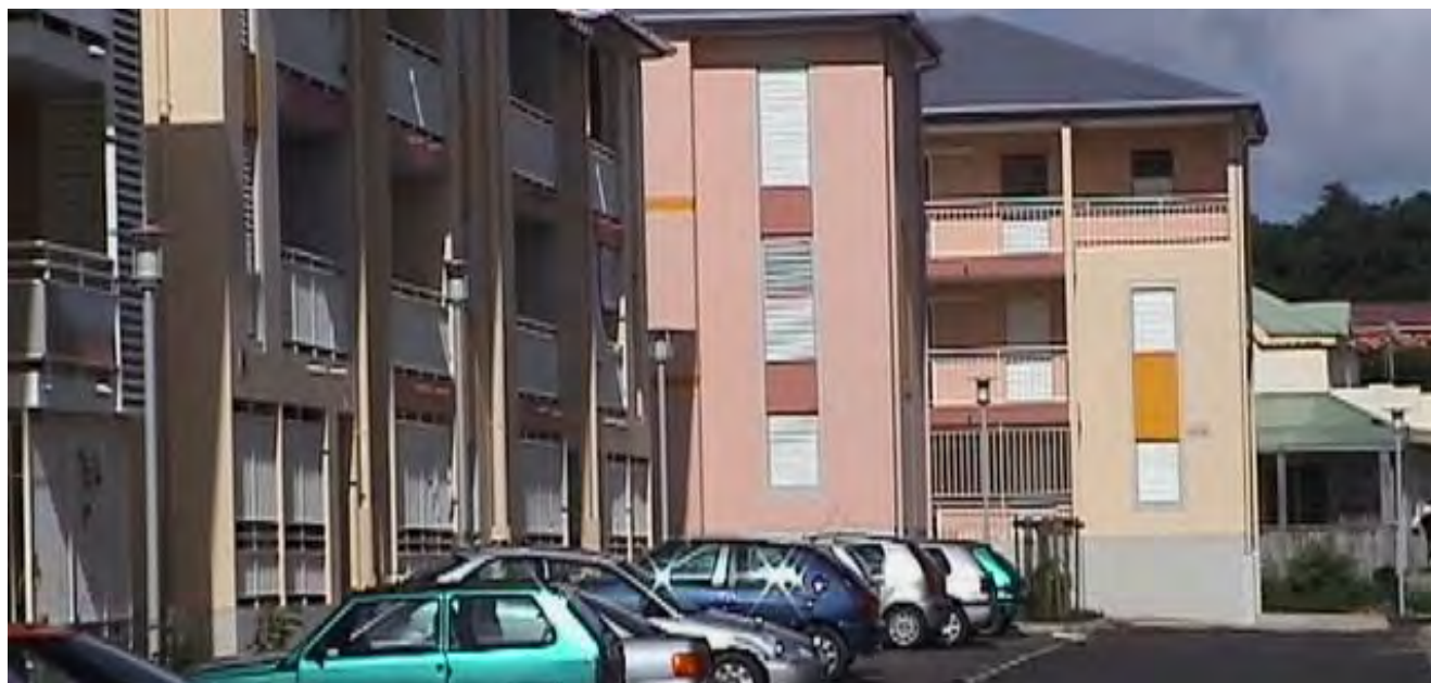
Logements Providence - Abymes