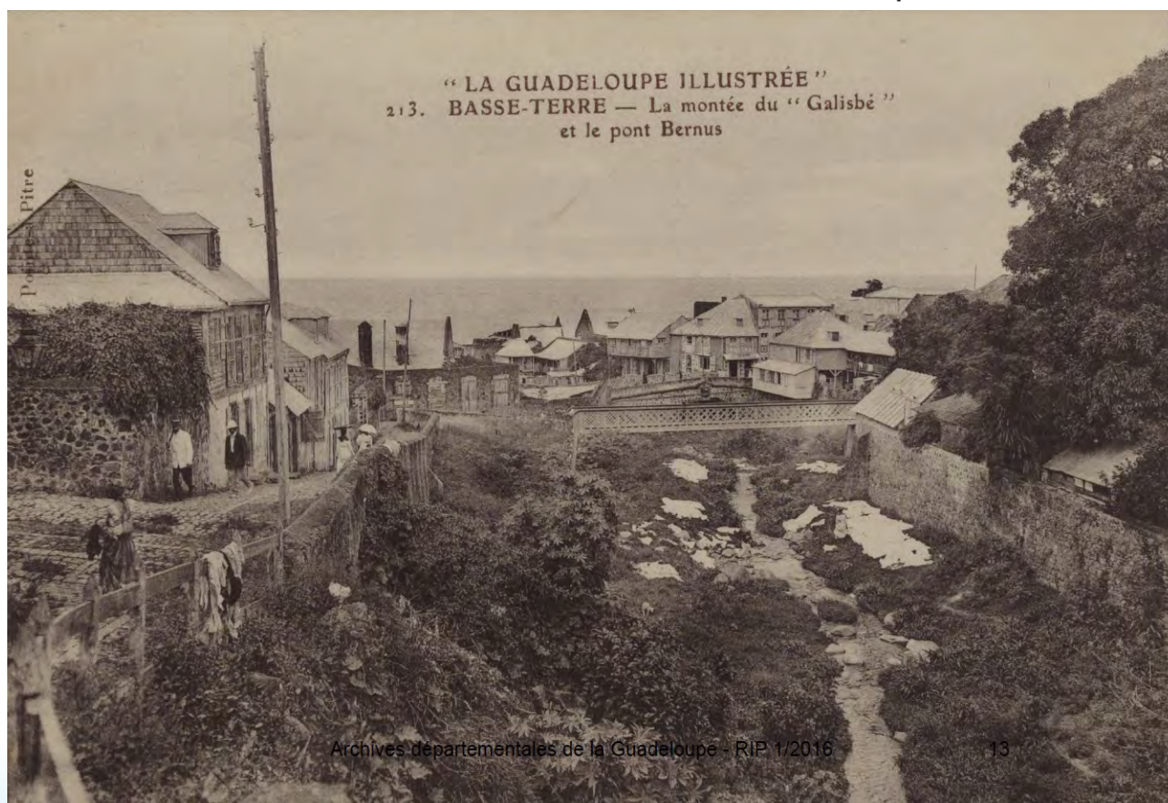
AVANT - Montée du «Galisbé» - vue du Pont Bernus