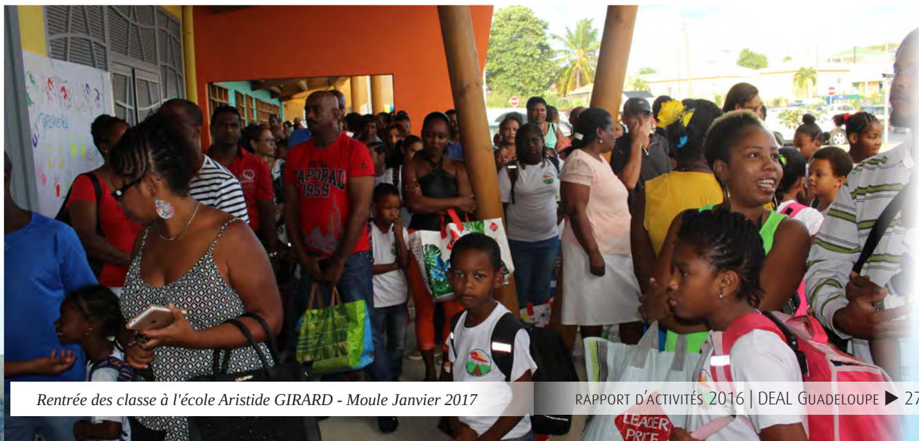
Rentrée des classe à l'école Aristide GIRARD - Moule Janvier 2017