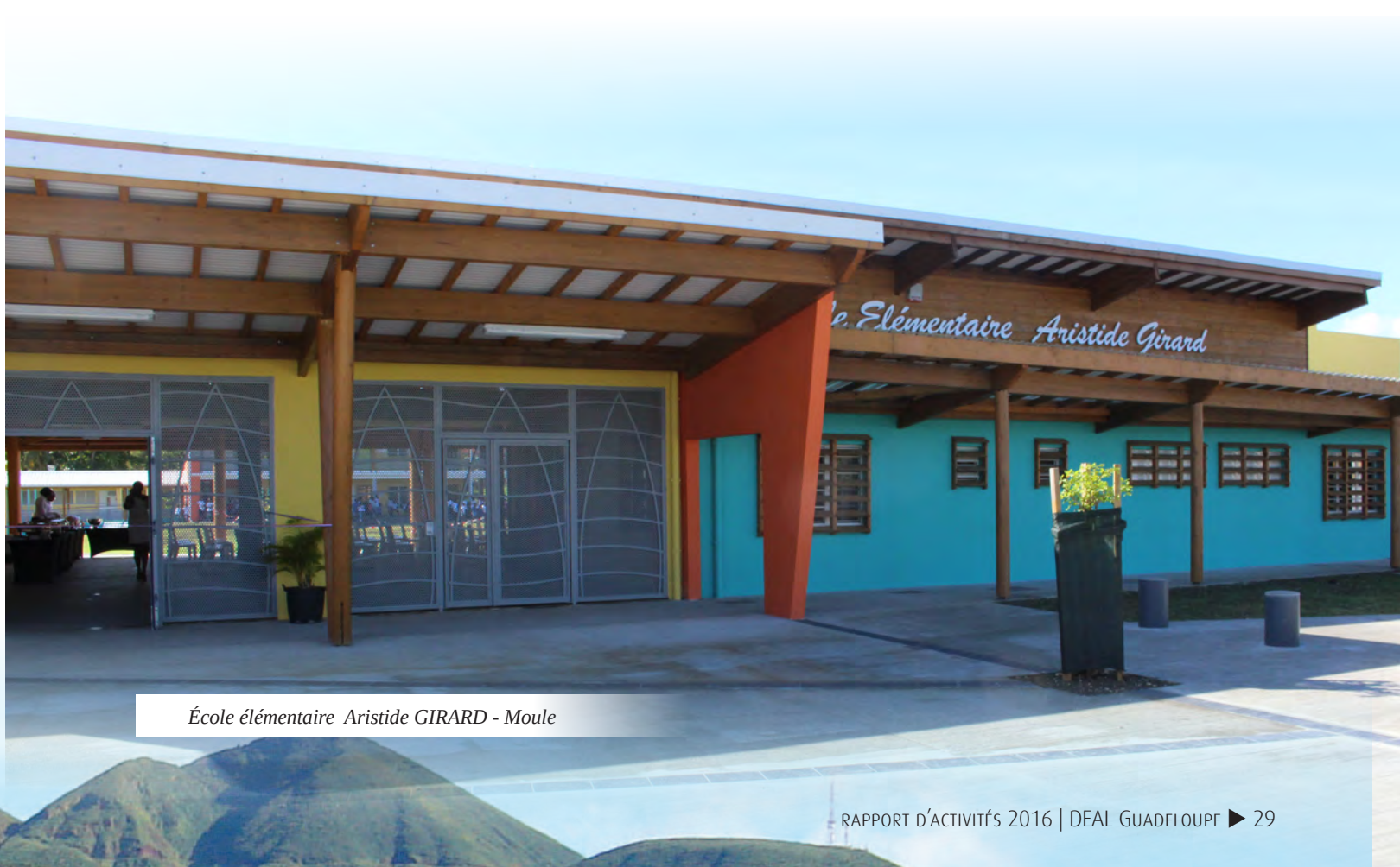
École élémentaire Aristide GIRARD - Moule

carrières de l'archipel (préjudiciables pour les coraux notamment) ainsi que sur les rejets aqueux de substances dangereuses visées par la directive cadre sur l'eau (la surveillance des rejets de 4 établissements a d'ores et déjà été renforcée dans ce cadre).