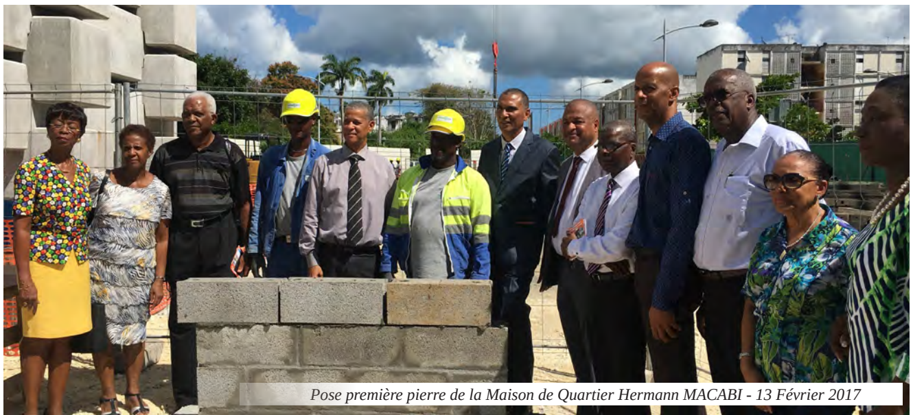
Pose première pierre de la Maison de Quartier Hermann MACABI - 13 Février 2017

En Guadeloupe, la communauté d'agglomération Cap Excellence a réaffirmé son engagement dans l'élaboration d'un programme de renouvellement urbain sur son territoire en précisant notamment les quartiers qui feront l'objet de son nouveau programme de renouvellement urbain. Cet engagement a également été rappelé lors du FRARU (forum régional des acteurs de la rénovation urbaine) Antilles-