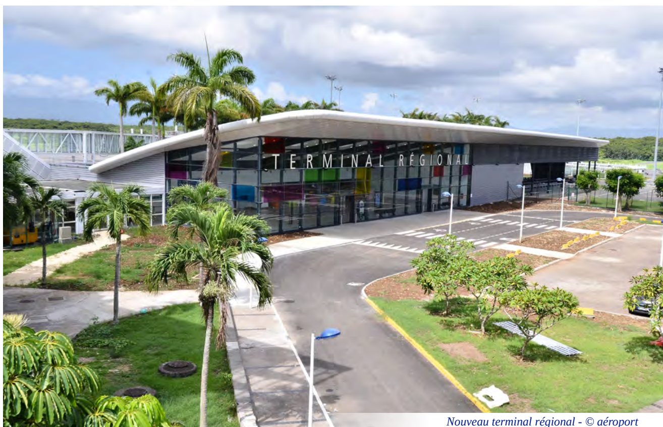
Nouveau terminal régional - © aéroport

l'Environnement) et de suivi des grands projets structurants pour le territoire (TCSP, Volcano park, ...).