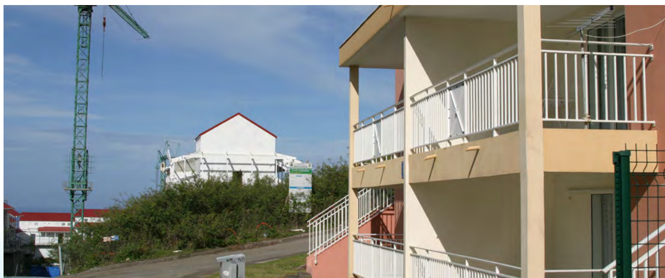
Logements Morin - Saint-Claude

Enfin, l'effort de résorption de l'habitat indigne est maintenu, par une poursuite des opérations engagées (une quinzaine) à travers le paiement de plus de 9 millions d'euros et l'engagement de 1,5 millions, permettant la livraison de 140 logements.