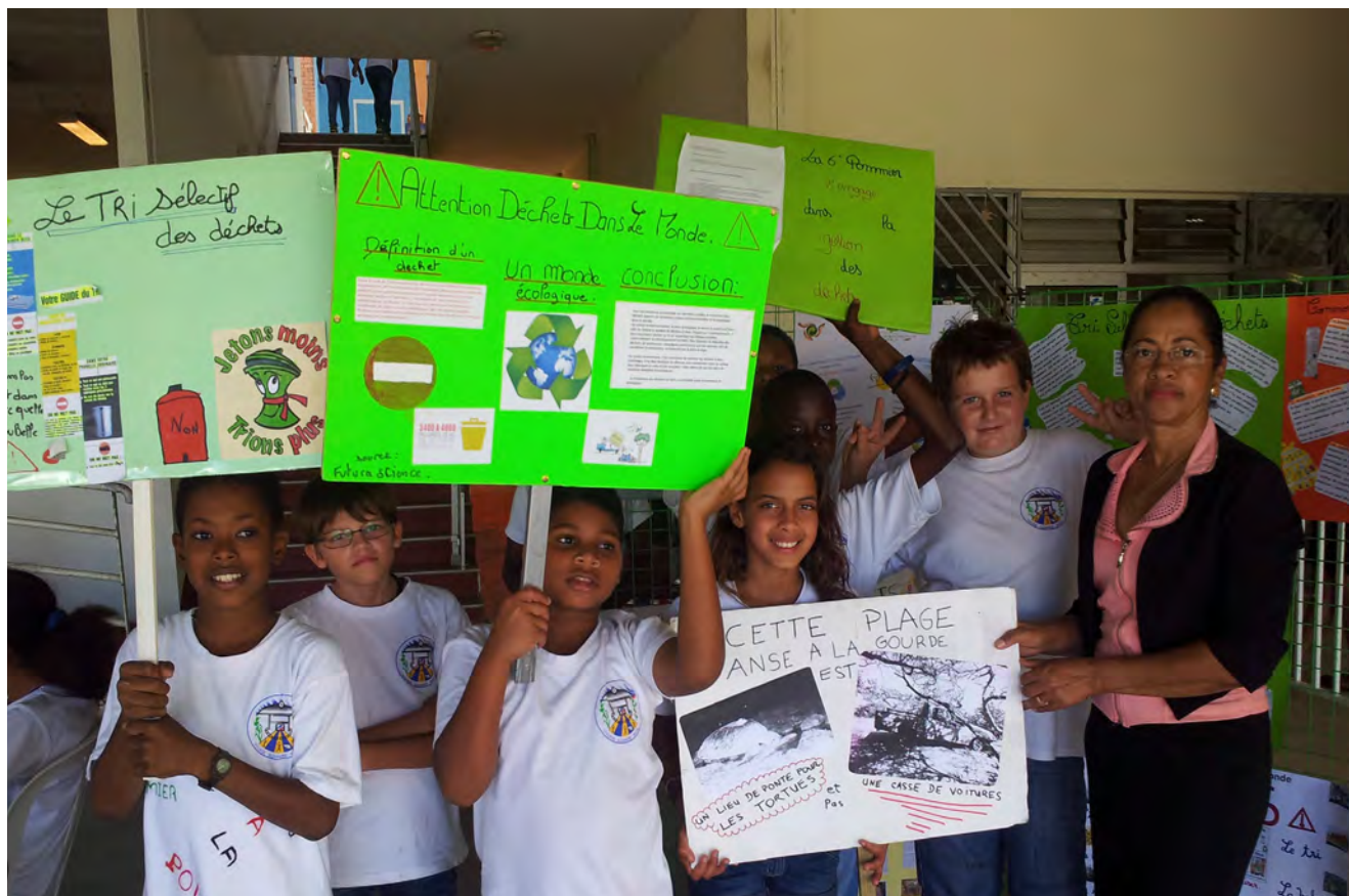
Forum EEDD à Baie Mahault - Mars 2016

La Mission Développement Durable et Évaluation Environnementale (MDDEE), avec en son sein le pôle dédié à la transition écologique, a assuré la promotion des nouvelles dispositions relatives au développement durable : la Stratégie Nationale de Transition Écologique vers un Développement Durable (SNTEDD) 2015-2020 et les Objectifs du Développement Durable (ODD) de l'agenda 2030.