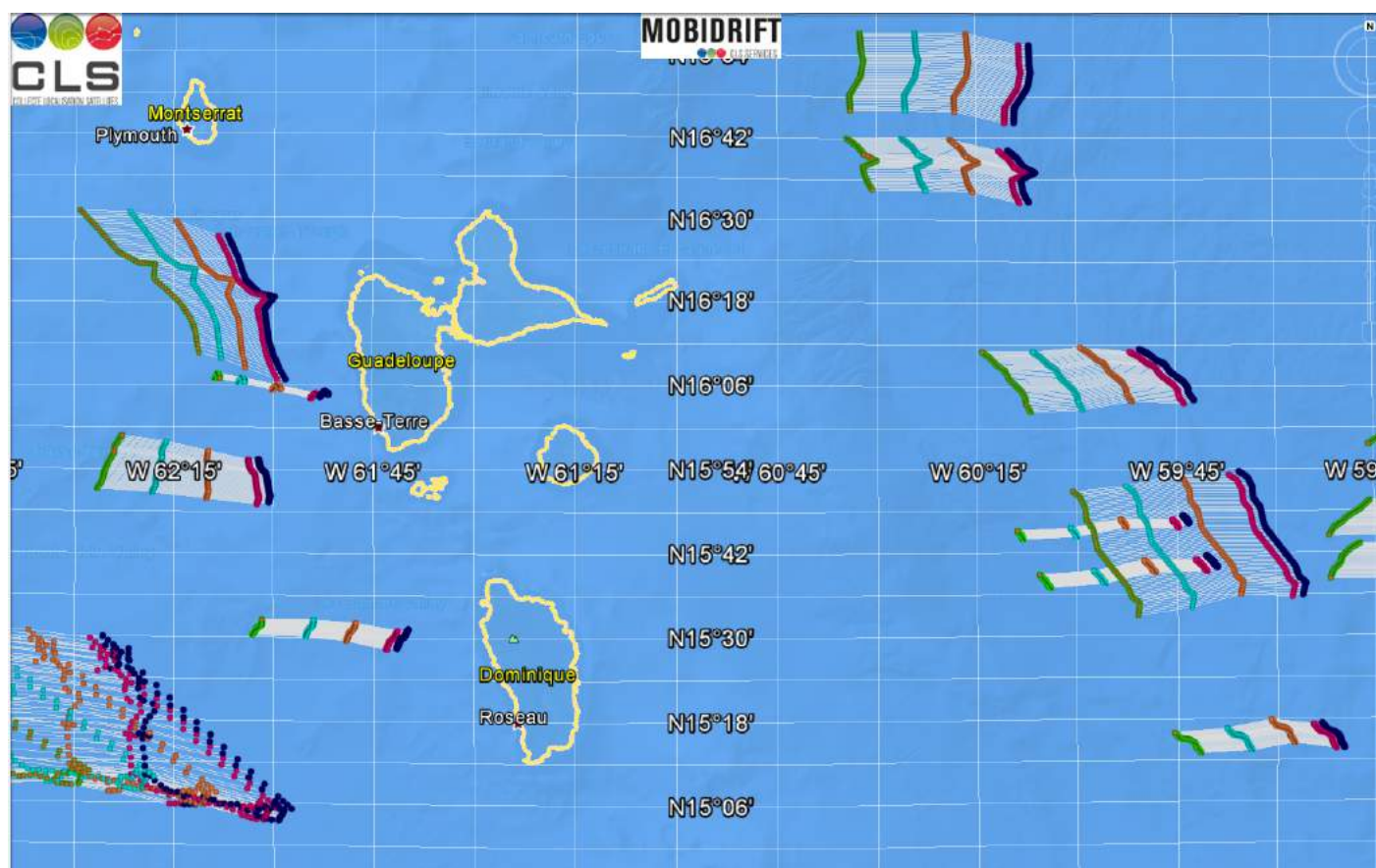
Figure 1 Positions estimées des radeaux de sargasses à 00h UTC les 12 (rose),13 (orange),14 (bleu),15 juillet (vert) à partir des détections du 11 juillet 2017 à 17h48 UTC (noir)

Les figures ci-dessous présentent les résultats de la dérive des bancs détectés le 11/07/2017 à 17h48 sur les 3 jours suivants à 00h UTC les 12,13,14,et 15 juillet.