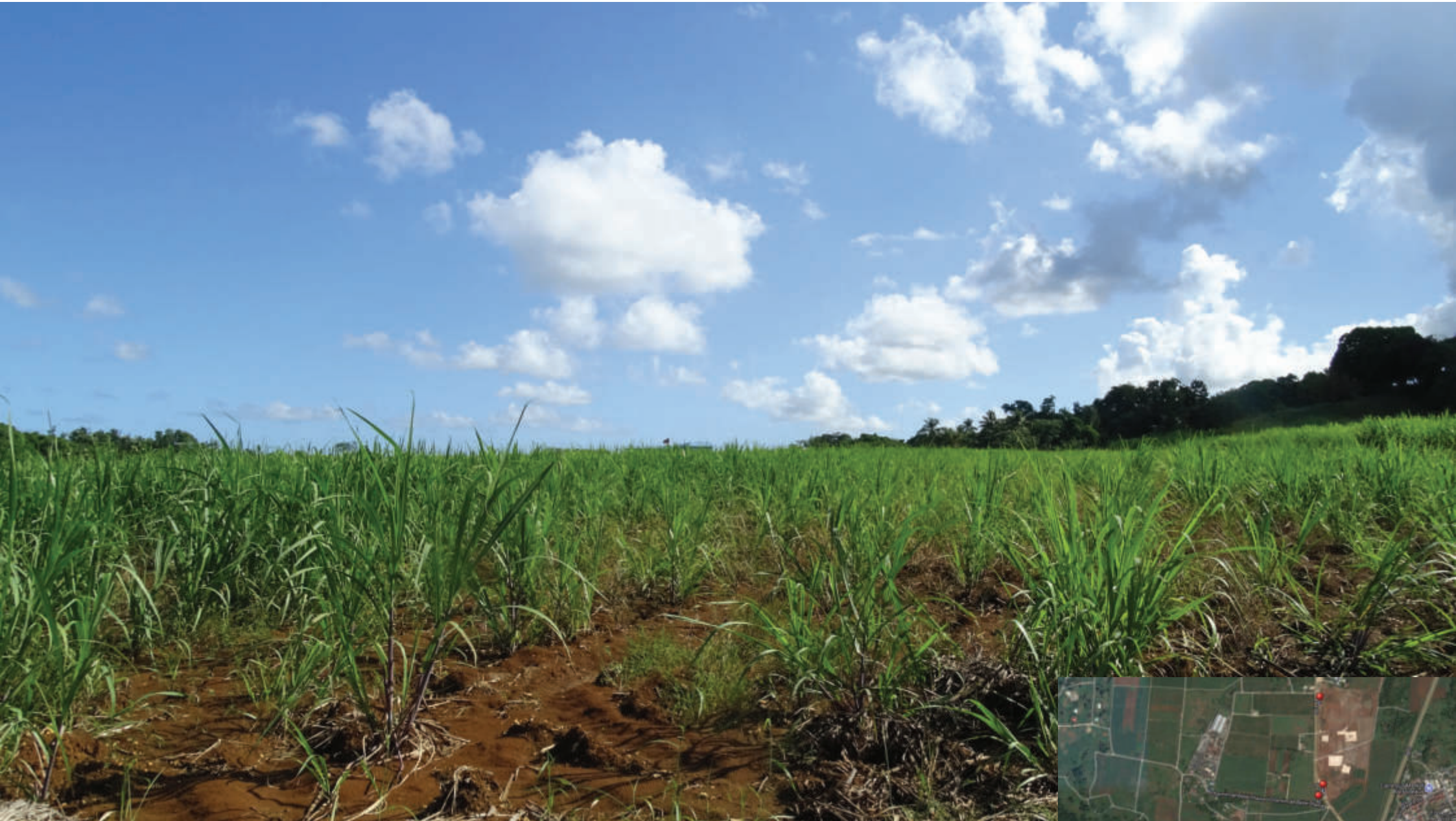
Annexe 3 photo 1 (2018)