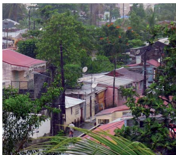
Pointe-à-Pitre et sa végétation