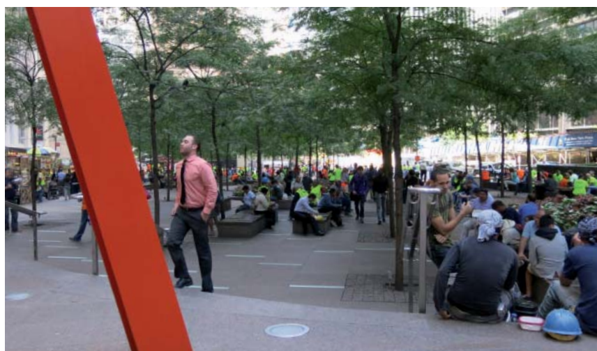
appropriation sociale d'un espace public planté pour la pause déjeuner à New-York

Les espaces verts publics créent des opportunités d'interaction entre des personnes issues de milieux sociaux et ethniques variés. Ces interactions sont autant de moyens de participer localement à la vie de la communauté et de développer un sentiment d'acceptation, d'attachement.