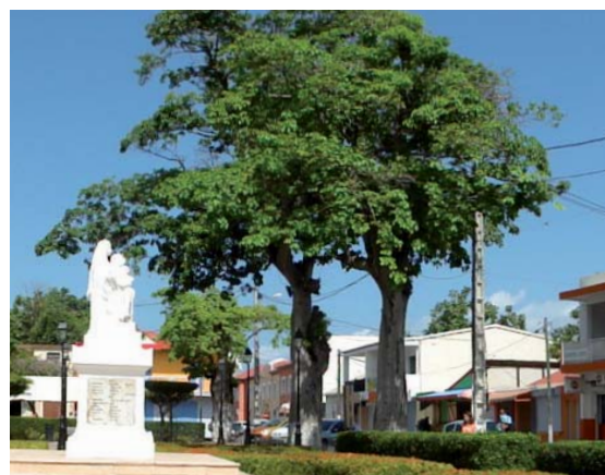
patrimoine arboré de Saint-François