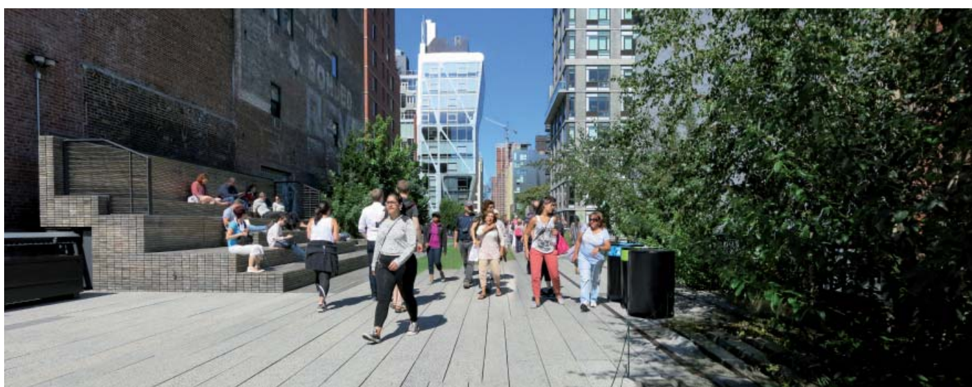
Parc de la High Line, à New-York, réalisé sur l'emprise d'anciennes voies ferrées désaffectées en concertation avec les habitants