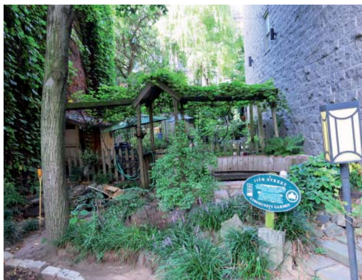
un des nombreux «Community Garden» de Manhattan (New-York)

Aujourd'hui les modes d'appréhension de l'espace urbain évoluent et la végétation de l'espace public n'est plus seulement perçue comme un décor mais comme la fabrication de lieux de vie. Tous les acteurs doivent participer à cette fabrication, les habitants, les services de la ville et tous les intervenants qui concourent au bon fonctionnement de ces lieux et à l'insertion sociale et économique des habitants. Il s'agit surtout de favoriser l'appropriation par les habitants de leur cadre de vie, en les faisant participer à la revitalisation de leur quartier. Les plantations constituent un formidable levier pour favoriser le dialogue, assurer un usage des lieux et induire une bonne gestion dans le temps. La Nature en Ville peut ainsi donner un nouvel élan à la citoyenneté.