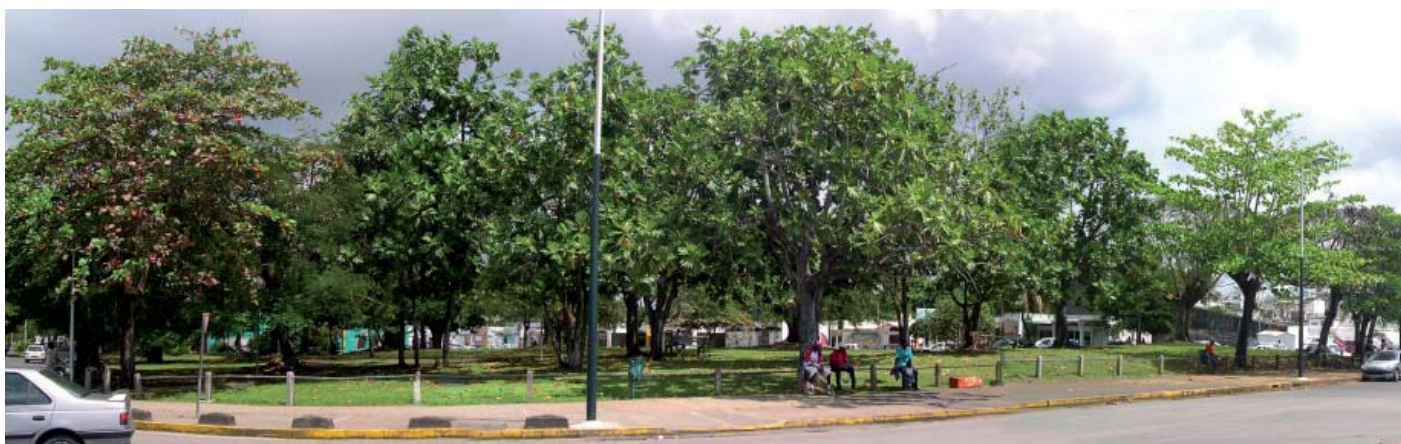
fruitiers sur l'espace public près du cimetière de Pointe-à-Pitre