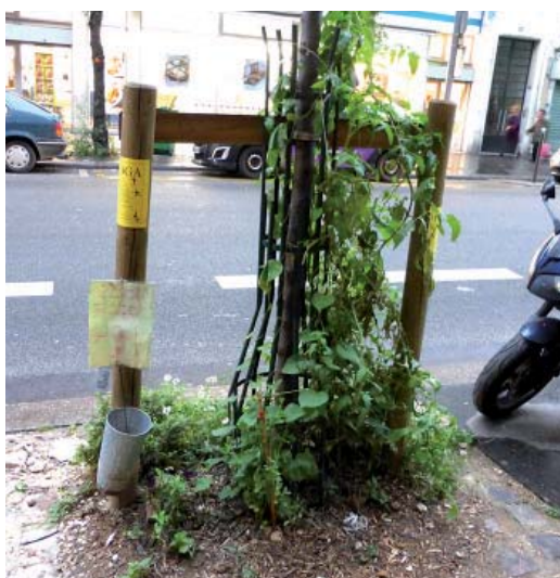
fleurissement des pieds d'arbres à Paris