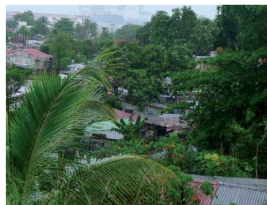
le végétal dans les faubourgs de Pointe-à-Pitre

Les relations entre les Guadeloupéens et le végétal reposent essentiellement sur la consommation et la protection. Le modèle du « jardin bo kaz » encore bien ancré dans les mentalités. Même si les conditions de vie dans les zones urbaines ne sont pas propices à recréer ce cadre de vie, les citoyens continuent à planter des Arbres à pain, des Avocatiers et autres bananiers derrière les murs, au pied des immeubles voire dans certains espaces verts de la ville. Le rapport au végétal est donc encore riche au niveau individuel mais paradoxalement il est presque inexistant d'un point de vue collectif. Les espaces verts collectifs sont souvent peu fréquentés, rarement respectés voire détériorés.