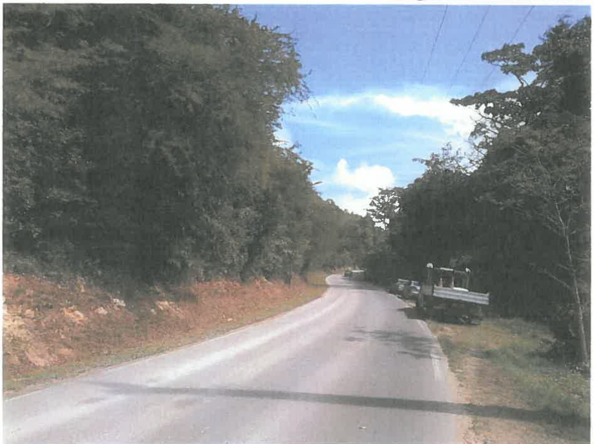
Angle de vue D