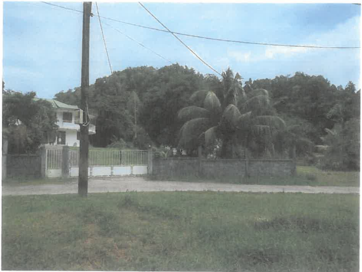
Angle de vue A