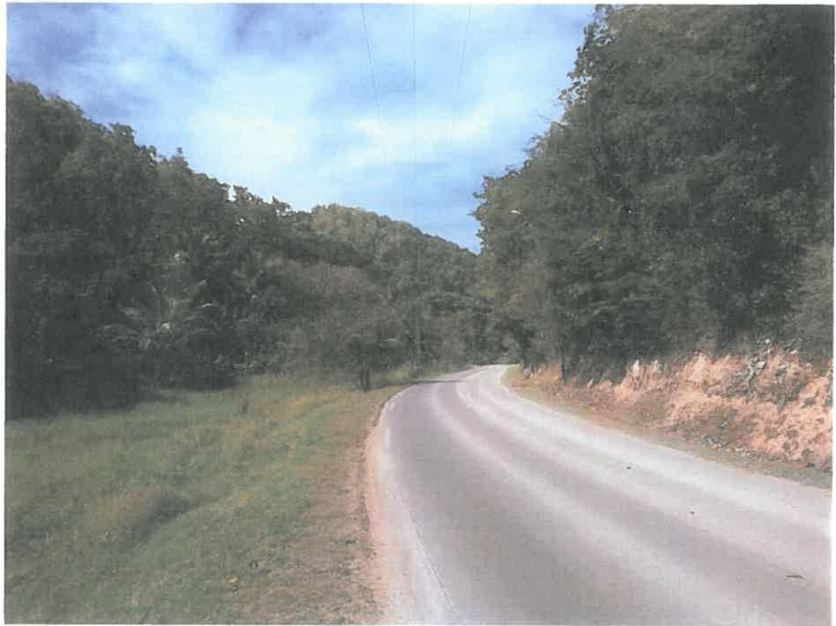
Angle de vue C