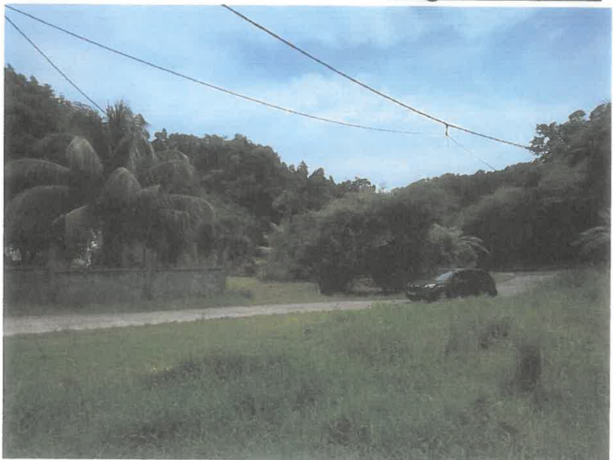
Angle de vue B