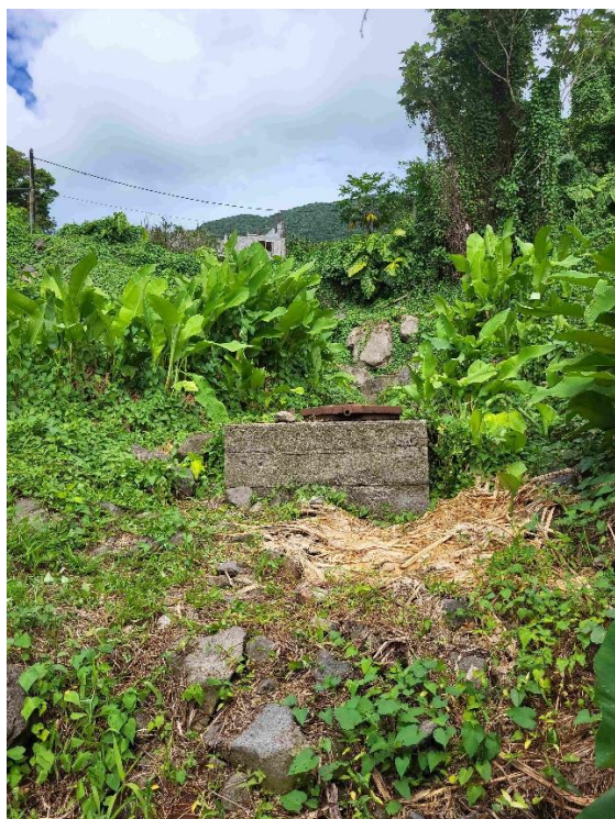
Collecteur amont (Photo 1)