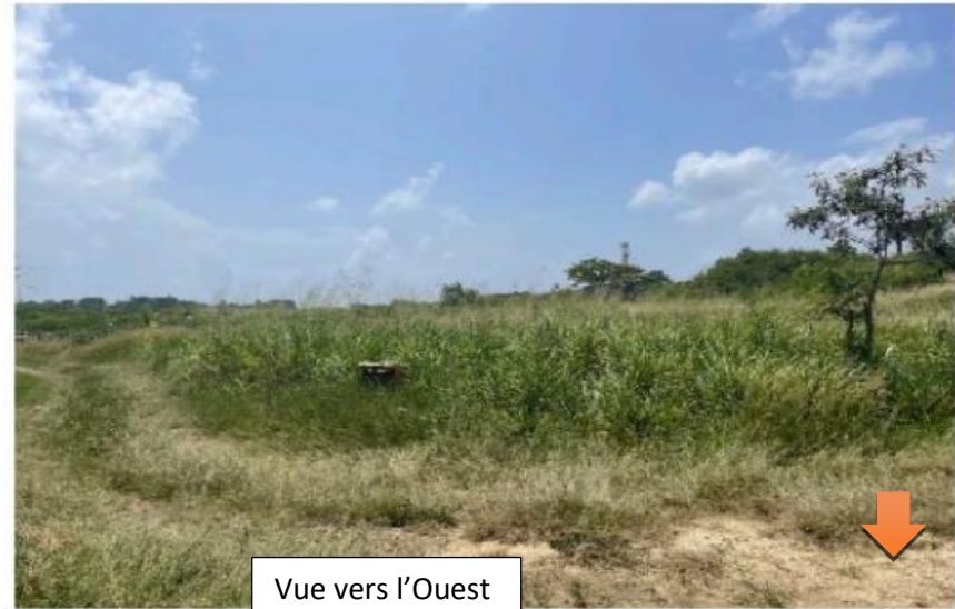
Vue vers l'Ouest