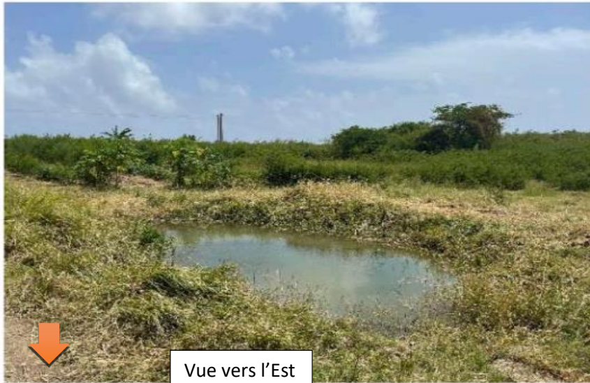
Vue vers l'Est