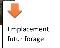
Emplacement futur forage