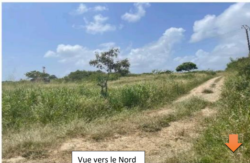
Vue vers le Nord