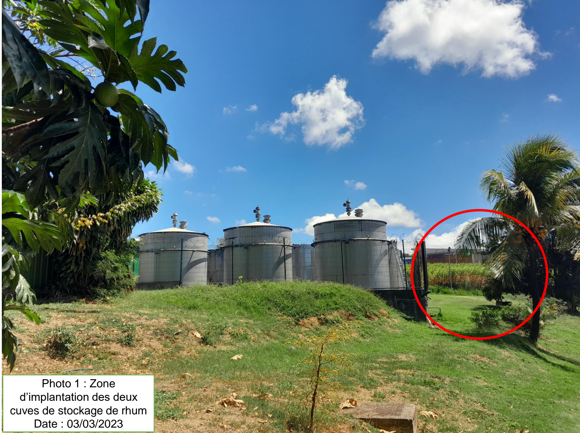
Photo 1 : Zone d'implantation des deux cuves de stockage de rhum Date : 03/03/2023