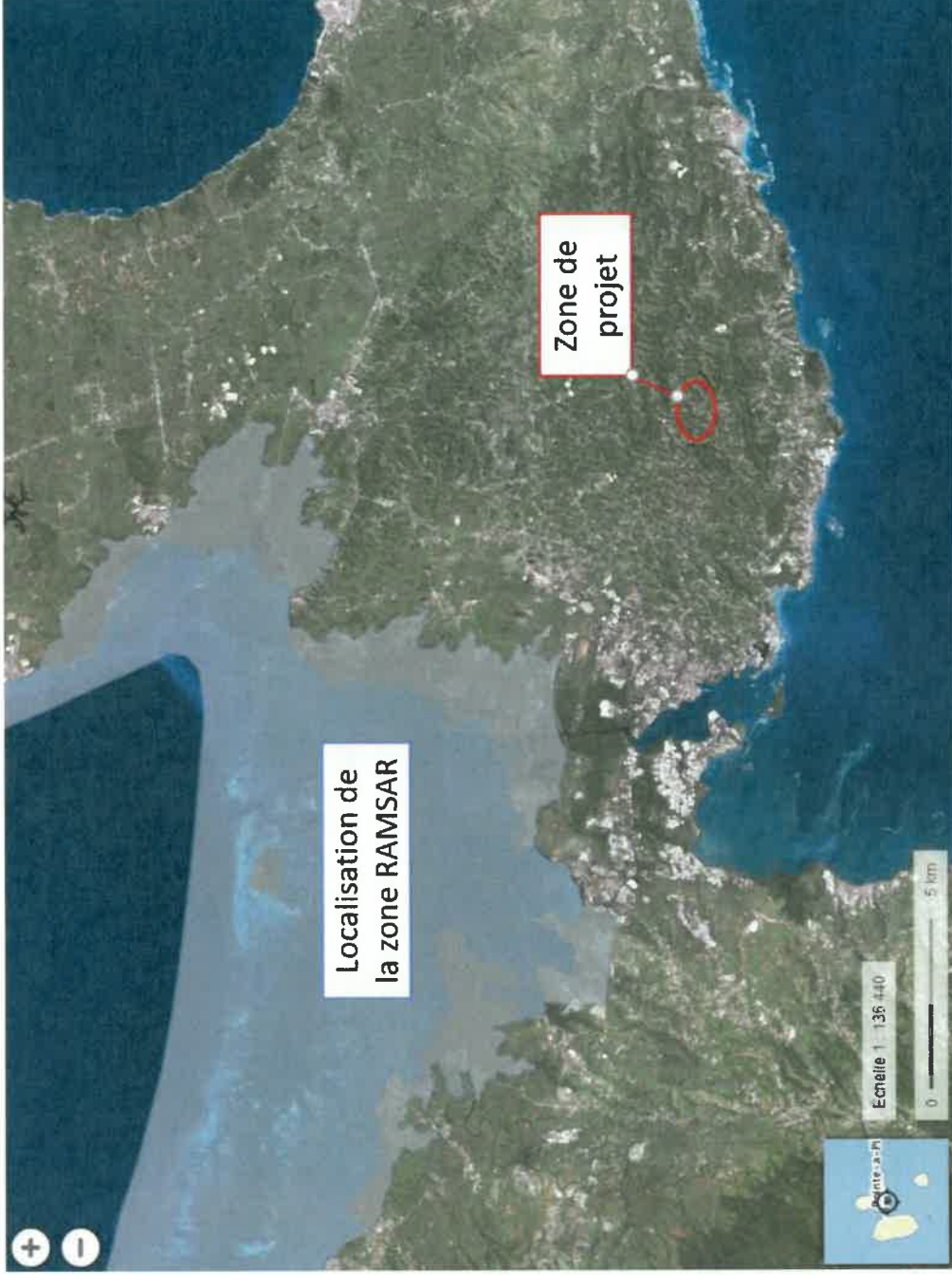
Figure 6 : Localisation des zones humides d'importance internationale (Sites RAMSAR) par rapport à la zone de projet