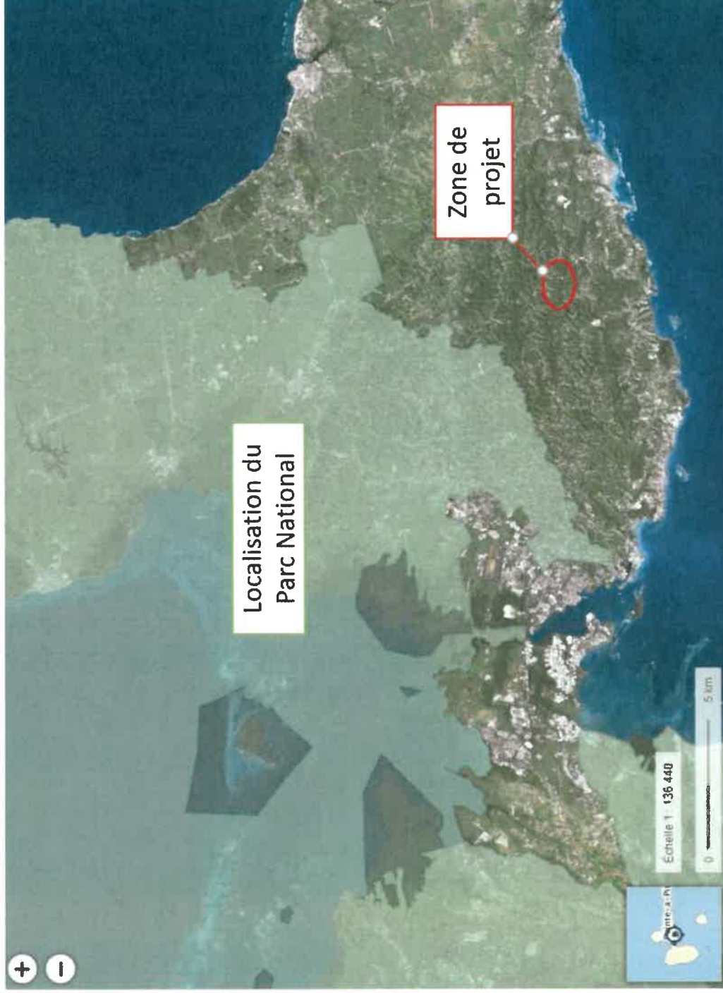
Figure 4 : Localisation des limites du Parc National de la Guadeloupe par rapport à la zone de projet