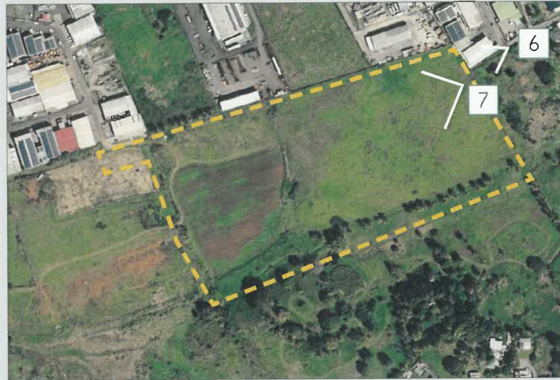
PLAN DE REPÉRAGE DES VUES