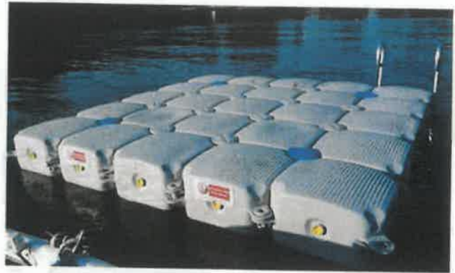
Figure 9 : Exemple d'appontements en cubisystem