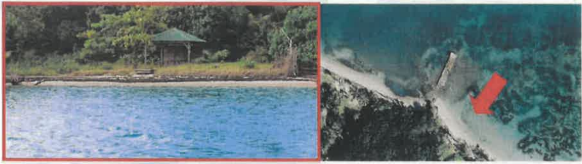
Figure 5 : proposition d'emplacement pour la ligne d'eau

Une ligne d'eau pour l'amarrage des annexes des navires a été retenue en Tranche Ferme.