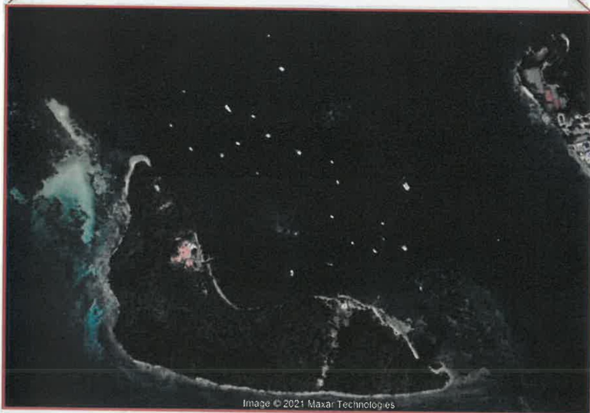
Figure 2 : Photo aérienne de la situation actuelle