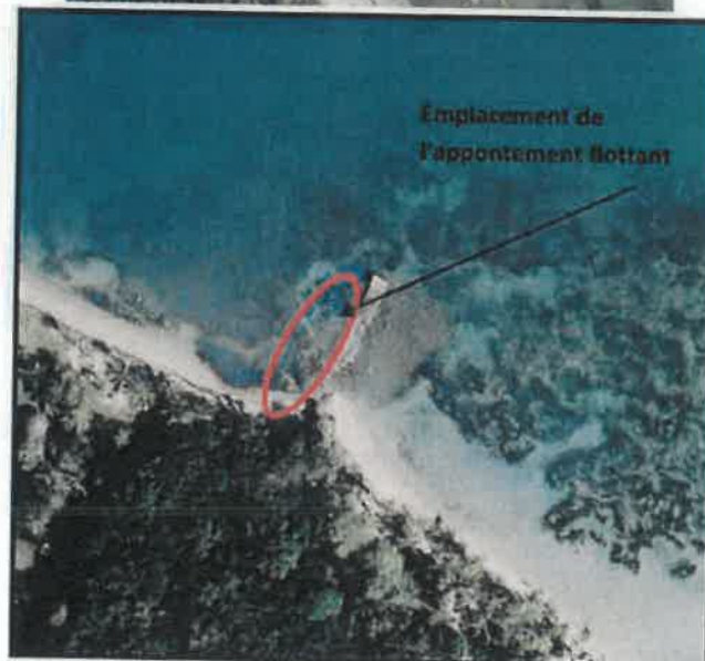
Figure 8 : Emplacement de l'appontement flottant