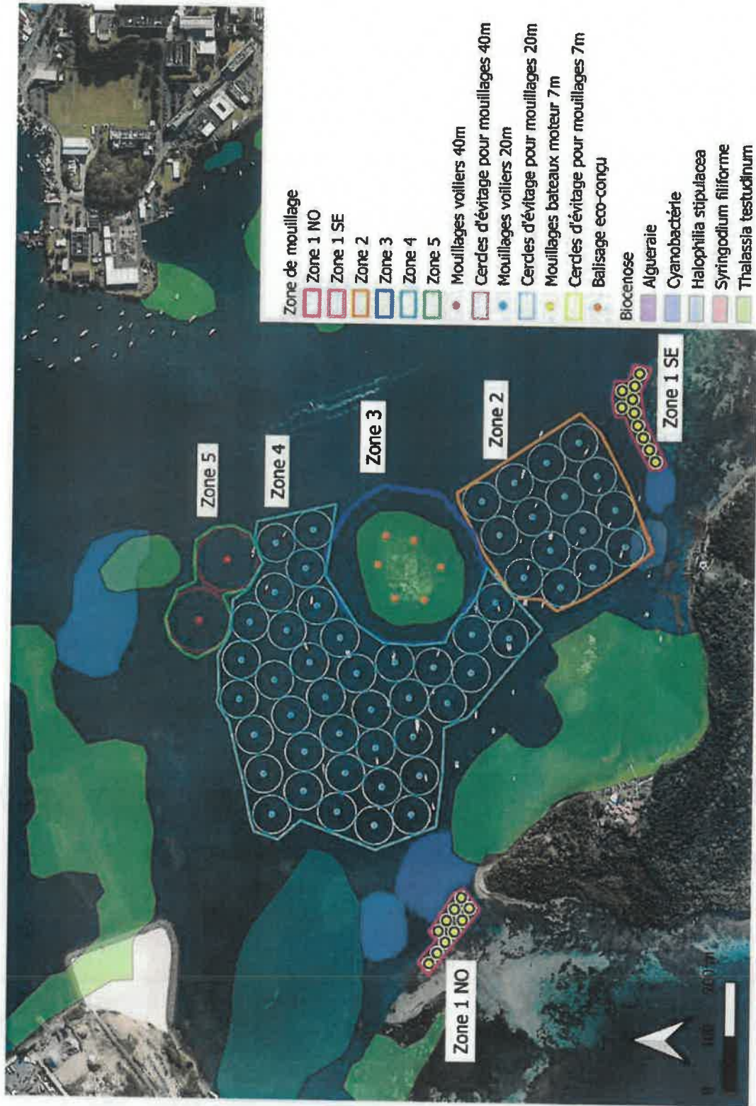
Figure 4 : Carte générale du projet et des biocénoses