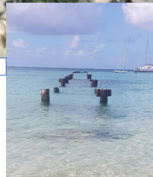
Ponton 2 ( ref. photo ci-dessus) Date : 14/09/22