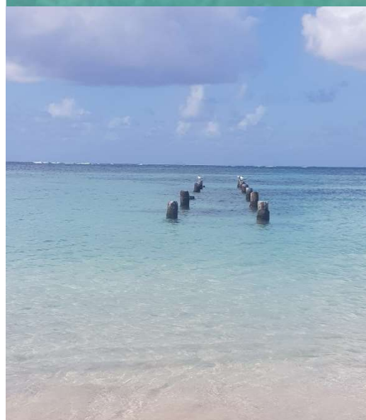
Ponton 1 ( ref. photo ci-dessus) Date : 14/09/22

Dernière mise à jour juillet 2022