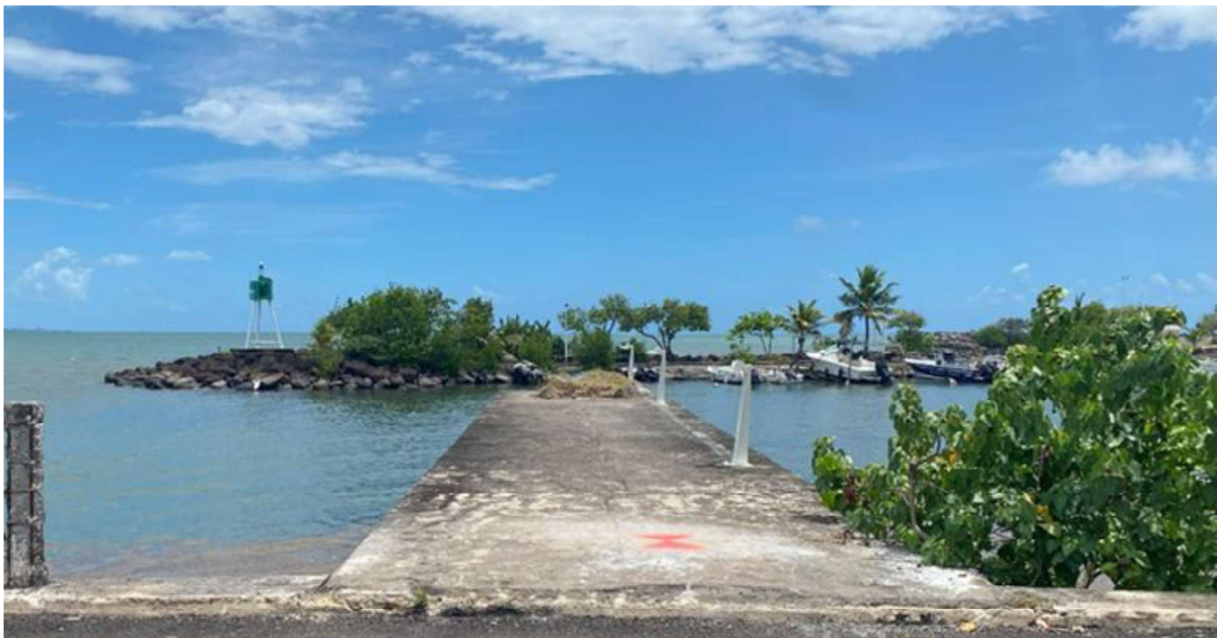
Figure 1 : Photo de la digue à l'entrée du bassin de mouillage (septembre 2025)