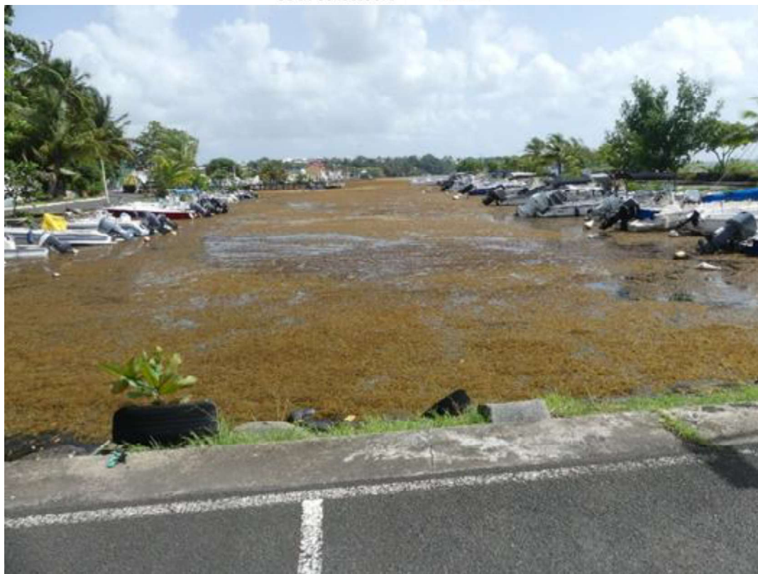
Figure 2 : Photo du bassin de mouillage vu du sud (septembre 2025)