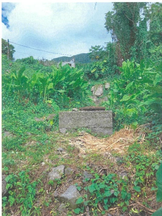
Collecteur amont (Photo 1)