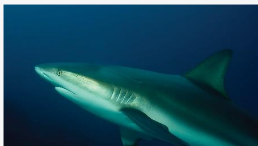
Carcharhinus perezii , St Martin