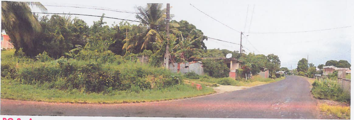
PC 8 -A