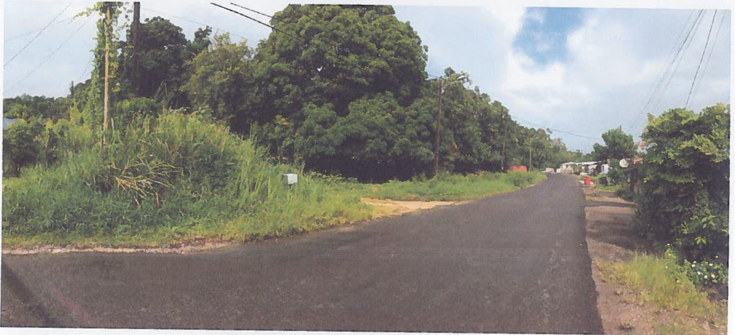
PC 8 -B