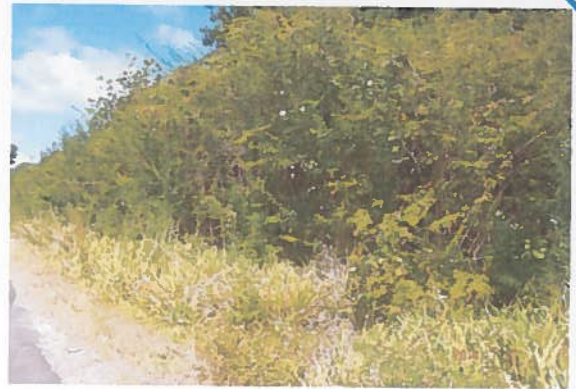
2. Photo en date du 21/01/2014 Bord de route recouvert de saint-domingues