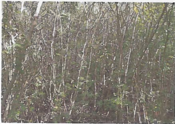
1. Photo en date du 21/01/2014 Bord du passage intérieur couvert de saint-domingues