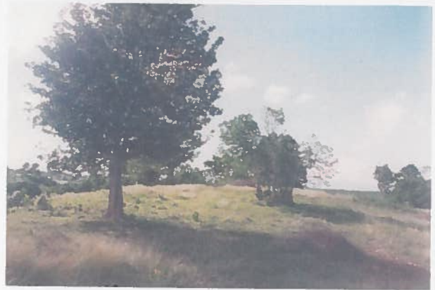
Photos de l'intérieur du terrain fournies par l'ancien propriétaire et datant de 1999.