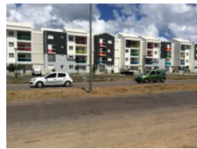
Des parkings bien soulignés