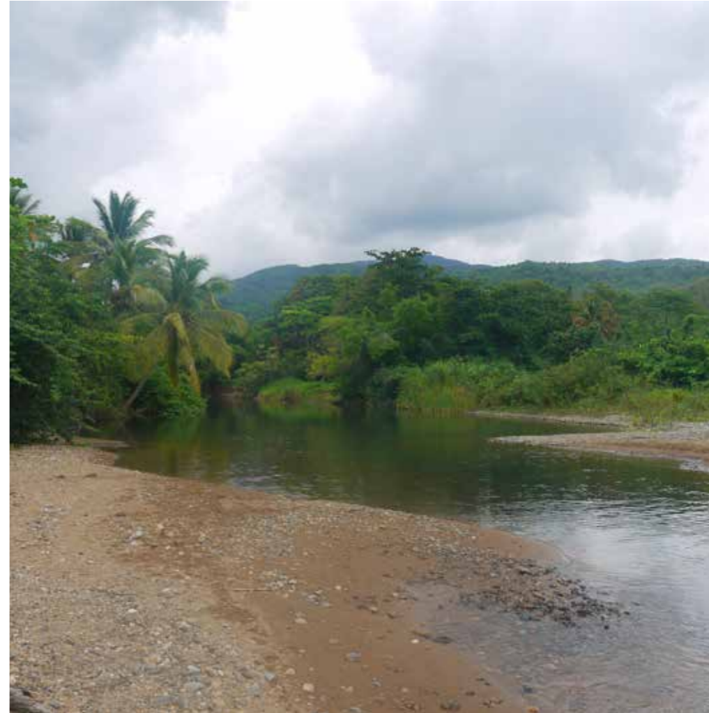
LA RIVIÈRE D'ACOMAT