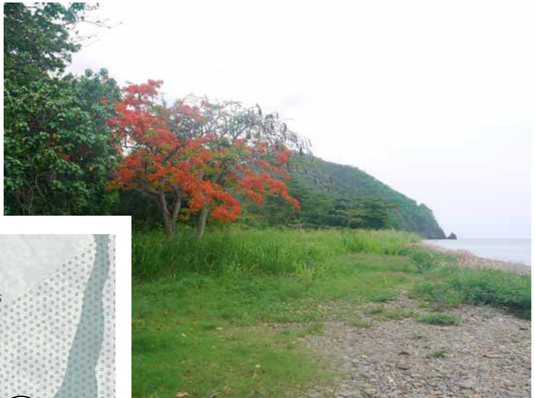
UN FLAMBOYANT ROUGE