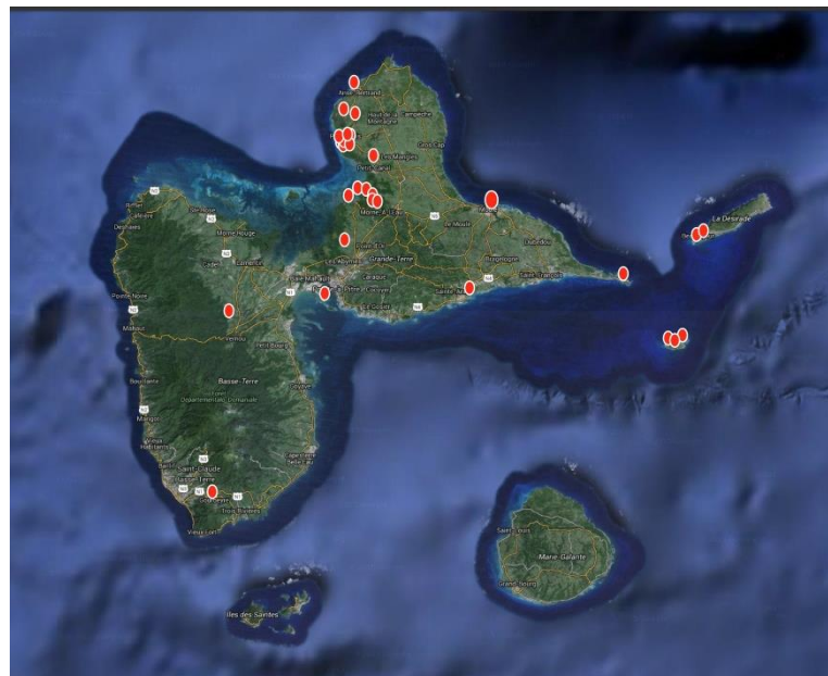
Figure 5: répartition des données de Pigeon à couronne blanche (AMAZONA)

Les données sont concentrées au nord-ouest de la Grande-Terre, et dans une moindre mesure dans le triangle Petite Terre, Désirade, Pointe des Châteaux. Trois données seulement ont été récoltées sur la Basse-Terre par AMAZONA.