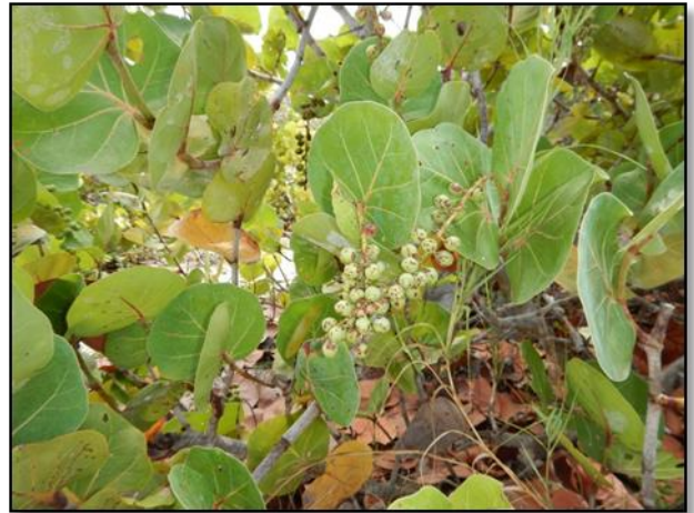
Figure 3: Raisinier bord de mer

Il se nourrit principalement de baies et de fruits, dans les forêts humides, semi-caduques et dans les zones arbustives. Des études ont recensé au moins 50 espèces de plantes constituant son alimentation. Sont incluses les espèces suivantes, présentes également en Guadeloupe : Raisinier bord de mer ( Coccoloba uvifera ), Cordia obliqua , Jamelonier ( Syzygium cumini ), Baselle blanche ou Epinard de Malabar ( Basella alba ), Acérola ( Malpighia emarginata ), Bois noir ( Capparis cynophallophora ), Typha ( Typha sp. ), Ficus aurea , Liane corail ( Antigonon leptopus ). (Otto A., comm. pers.)