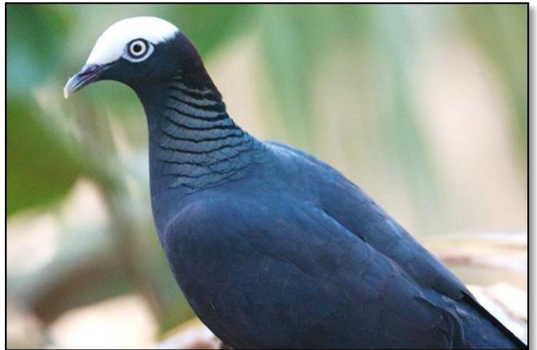
Figure 1: Pigeon à couronne blanche adulte

La femelle est plus terne, avec un peu de brun dans la calotte et sur le dos.