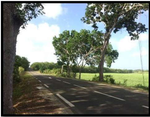
Figure 7: Mahogany en bord de route

que le ou les parents ont été tués à la chasse. Les données d'AMAZONA sont une faible proportion de la réalité. Deux témoignages de chasseurs montrent des effectifs bien plus importants. L'un d'entre eux signale tuer à la chasse une cinquantaine de Pigeons à couronne blanche par saison, son « record » étant de 15 en une journée. Ils sont chassés au poste sous les arbres à graines ou au vol sur certains passages.