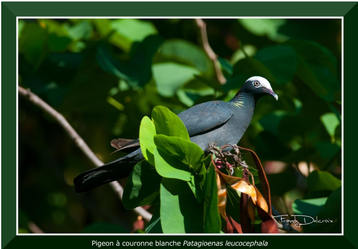
Pigeon à couronne blanche Patagioenas leucocephala