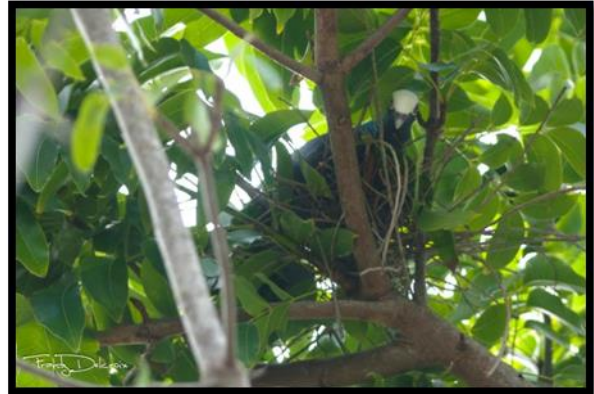
Figure 6: nid trouvé dans le Mahogany

De nombreux individus avaient un comportement faisant penser à des tentatives de reproduction. Le 04/07/15 un individu transportant des matériaux fut repéré, et un nid trouvé le 07/07/15, avec un couveur qui sera présent sur le nid jusqu'au 19/07/15. Il était dans un Mahogany grandes feuilles ( Swietenia macrophylla ) assez haut, bien camouflé, entre Port-Louis et Anse-Bertrand, au bord d'une route, avec des champs autour. Le 14 et le 19 juillet, deux relevés ont été effectués sur place, permettant d'observer que le nid se trouvait dans une zone où il y avait une activité de chasse importante. Le 25 juillet le nid était vide, aucune activité autour. Il est probable