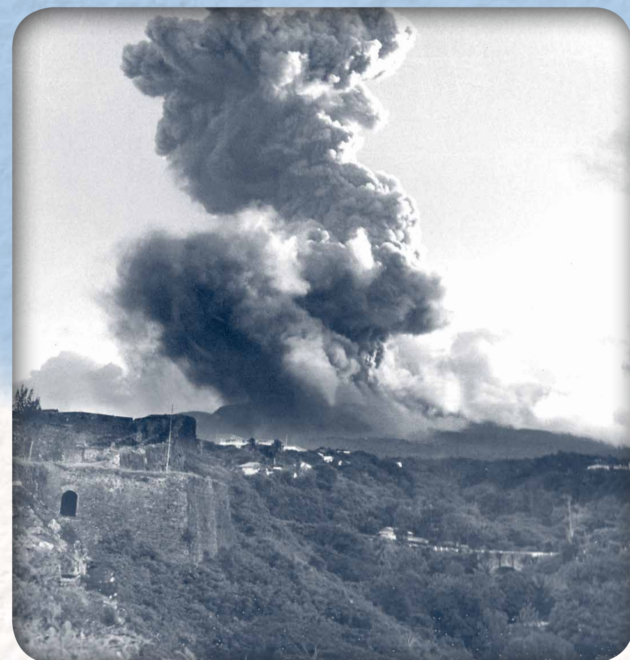
Éruption phréatique de la Soufrière : violente explosion le 22 septembre 1976

L'éruption phréatique est la plus fréquente : on en compte 6 sur les 330 dernières années.