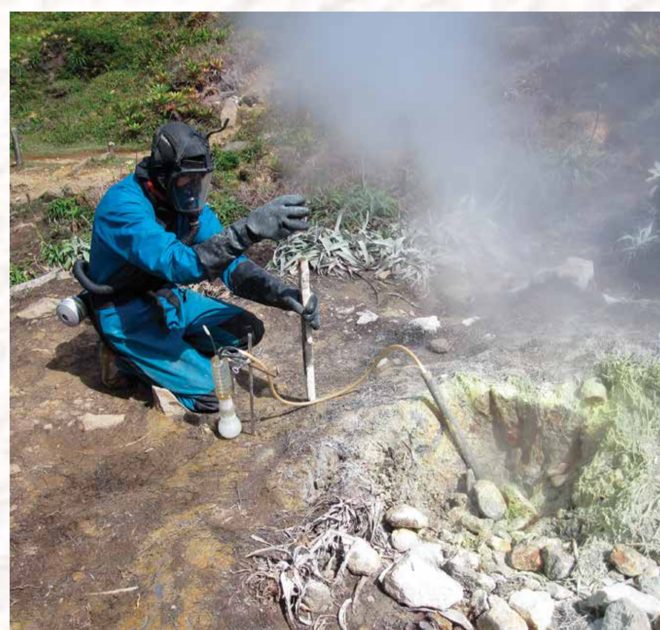
Prélèvement de gaz par l'OVSG au sommet de la Soufrière

L'observatoire volcanologique et sismologique de la Guadeloupe (OVSG) est chargé de surveiller 24h/24 l'activité de la Soufrière.