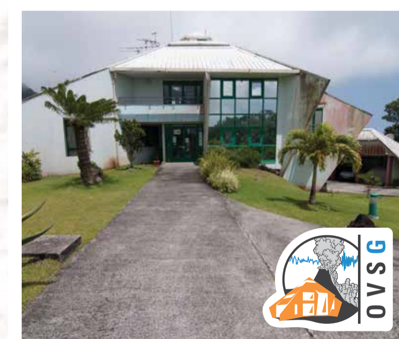
Locaux de l'OVSG au Houëlmont

Les services de l'État et des collectivités sont mobilisés.