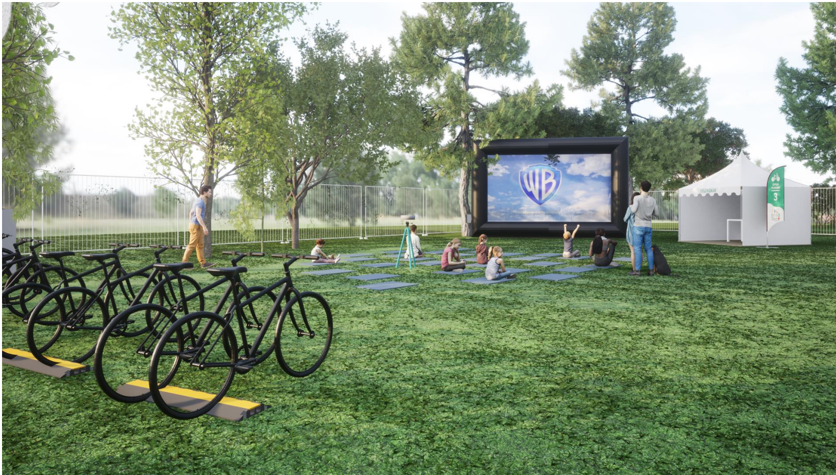
Visuels 3D non contractuels