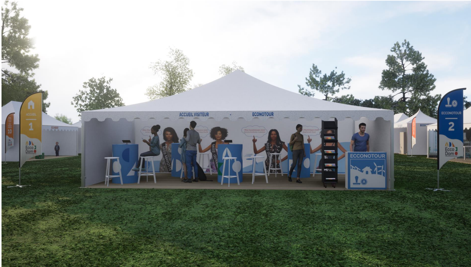
Visuels 3D non contractuels