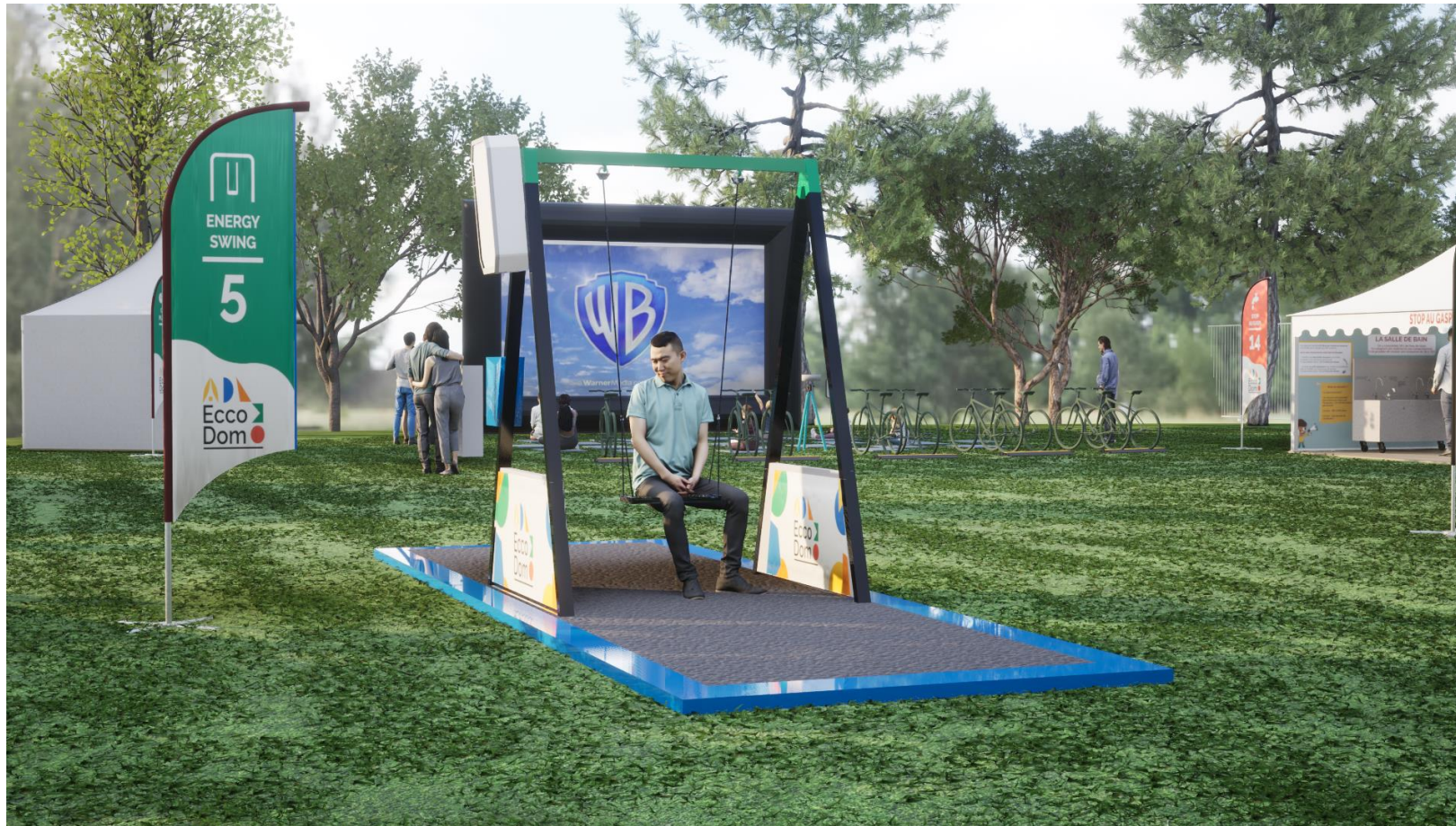
Visuels 3D non contractuels