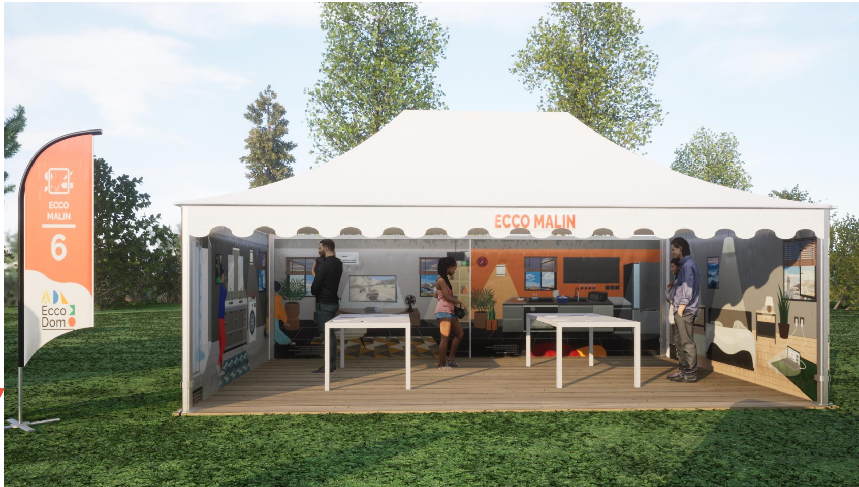
Visuels 3D non contractuels

◆ Une activité deux en un adaptée à tous les âges :