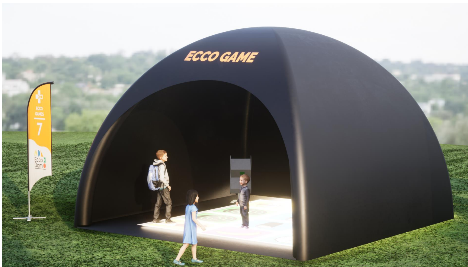
Visuels 3D non contractuels